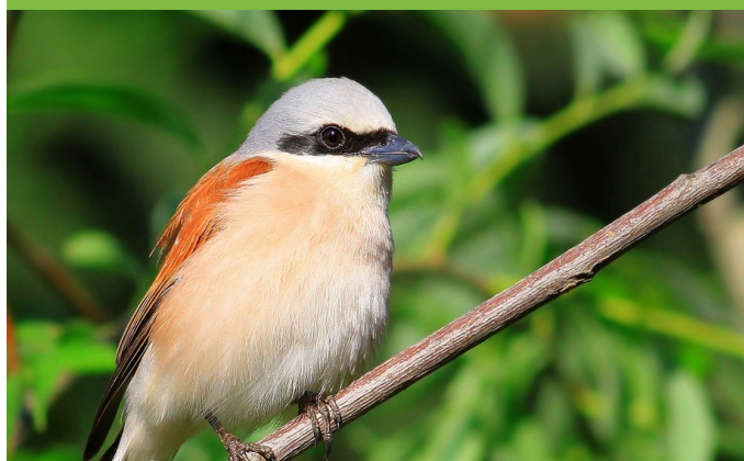
La pie-grièche écrocheur, espèce inféodée aux milieux ouverts, sera favorisée par l'ORE de 30 hectares.

- la mairie de Lussac-les-Châteaux (12,6 ha) : gestion d'un boisement âgé favorable aux chauves-souris et aux oiseaux et création de clairières favorables aux reptiles et aux insectes.