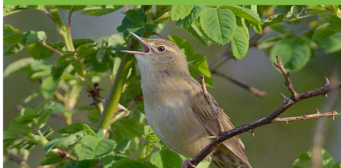
Locustelle tachetée : une hôte discrète mais en danger d'extinction des bords de rivières

La trame verte , notamment le réseau de haie, abrite de nombreuses espèces protégées au niveau national.