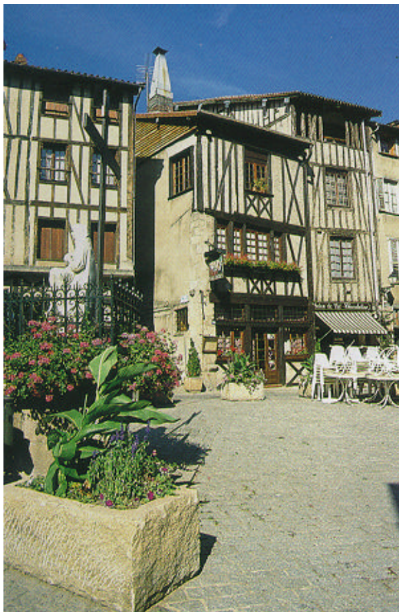
La place Saint-Aurélien.

la Vienne, le pont et les quartiers de la rive gauche. Les étages présentent encore des greniers ouverts où les tanneurs faisaient sécher les peaux.