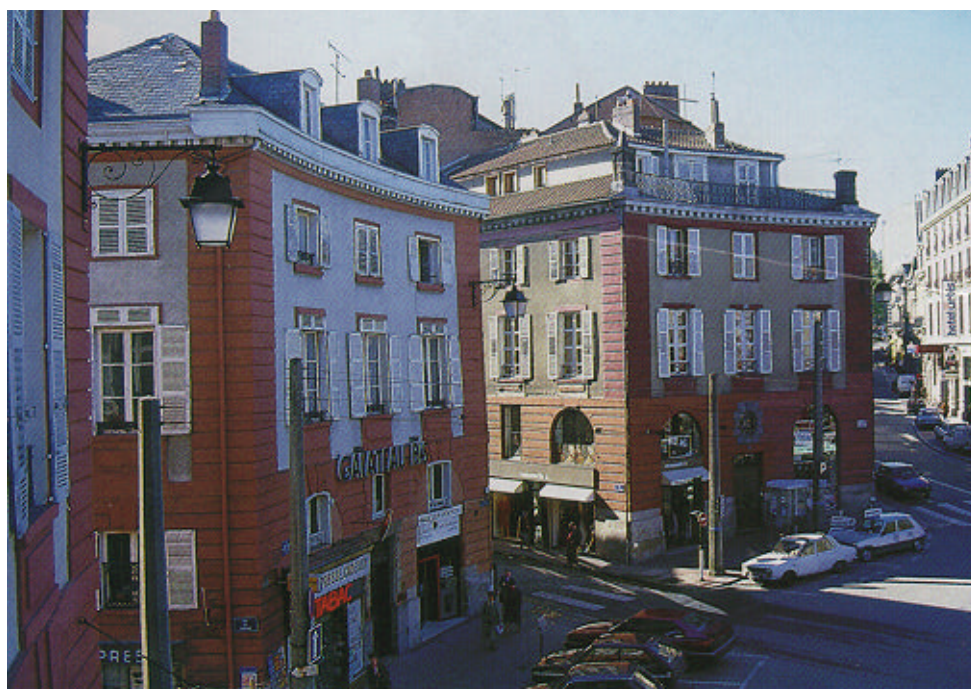
La place Denis-Dussoubs.

Au Nord-Est, dans l'axe du Pont Saint-Etienne, "l'Abbessaille", petit groupe de maisons accroché à la partie la plus abrupte du coteau est desservi par de pittoresques escaliers et ruelles pavées qui offrent des échappées sur