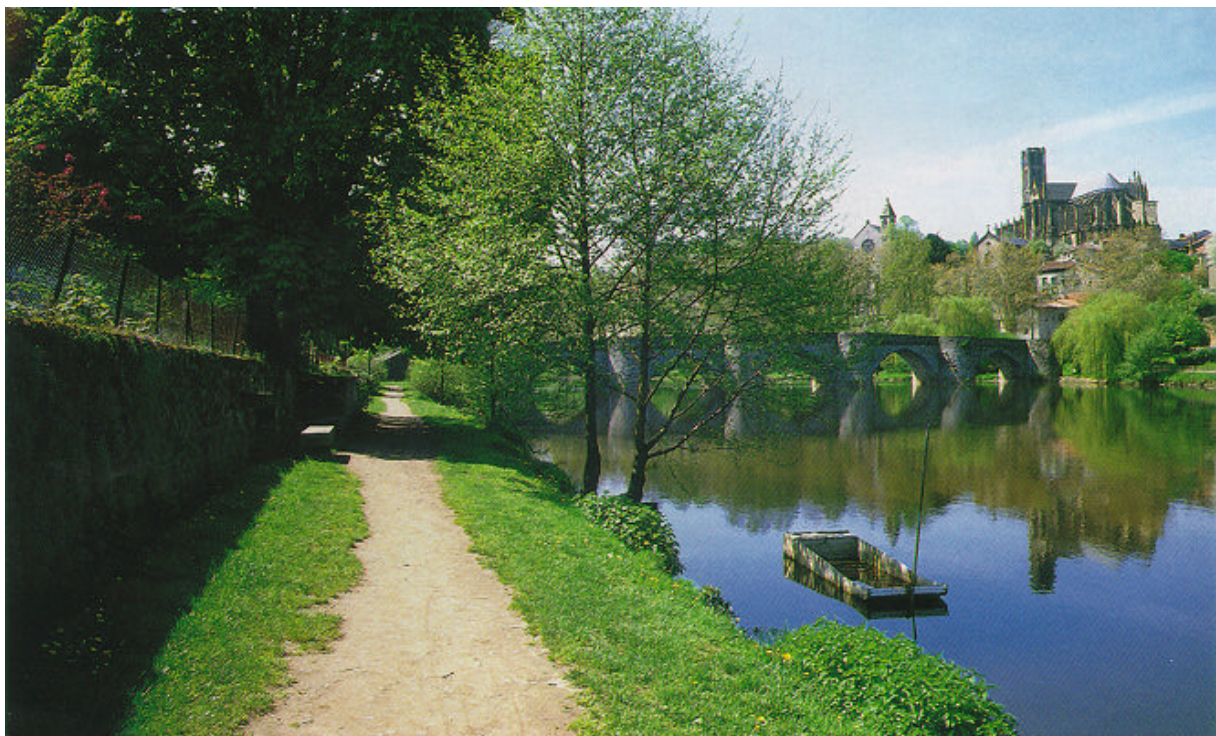
Le pont Saint-Etienne (XIII e s.) sur le Vienne.

Le donjon féodal des vicomtes de Limoges, établi au lieu-dit la Motte, près de l'église Saint-Michel des Lions donne son nom au quartier du Château. La première église daterait du VIème siècle et les lions auraient servi de support au siège d'un juge ecclésiastique au temps où les jugements se prononçaient aux portes des églises. Incendiée en 1112 et 1167, l'église est réparée. L'édifice actuel date du XIVème siècle, le portail Nord, gothique flamboyant de la fin du XVème et la dernière travée occidentale de 1552. La flèche, plusieurs fois détériorée par la