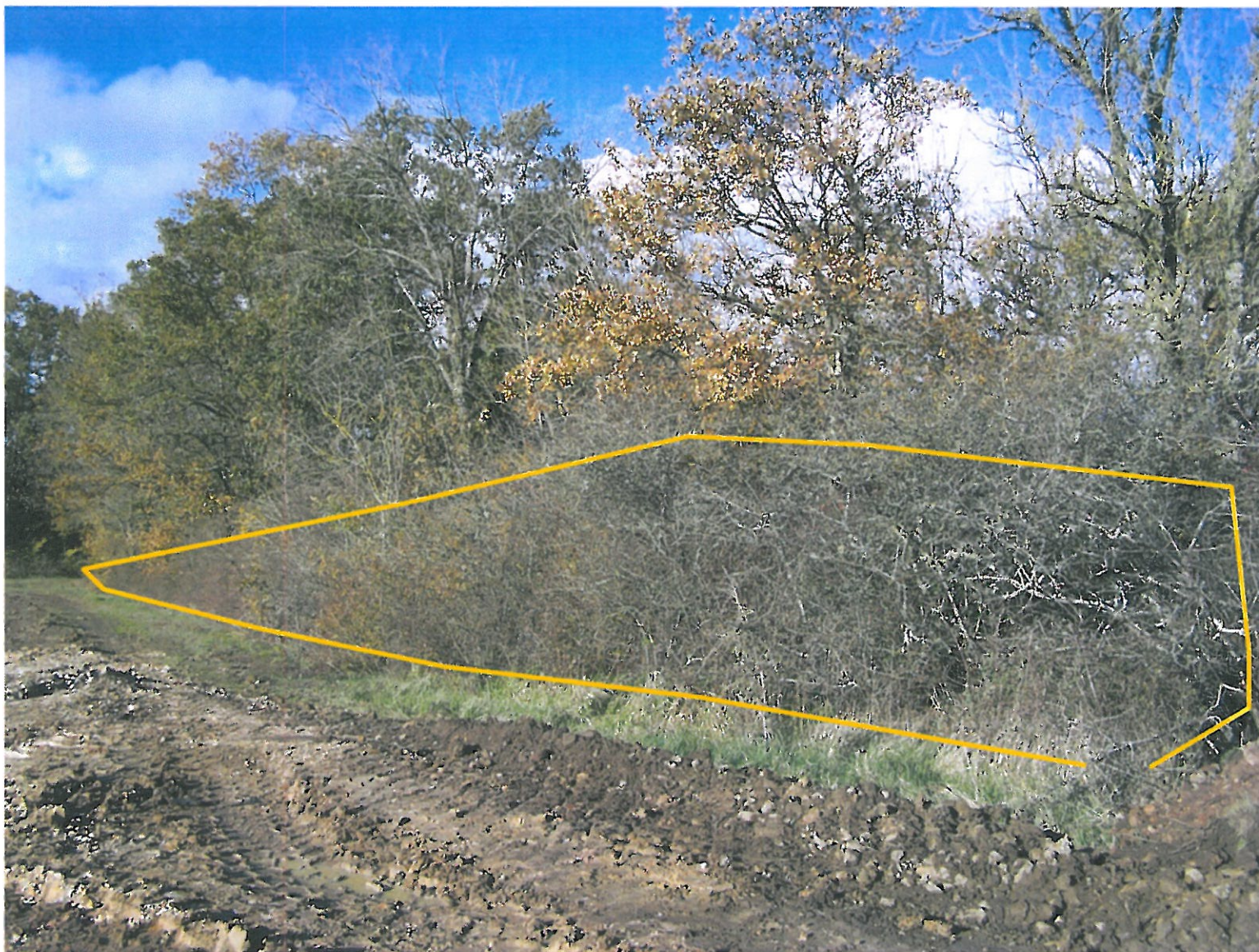
Photo B – Vue depuis la bordure Ouest du projet de défrichage (21-11-2012)