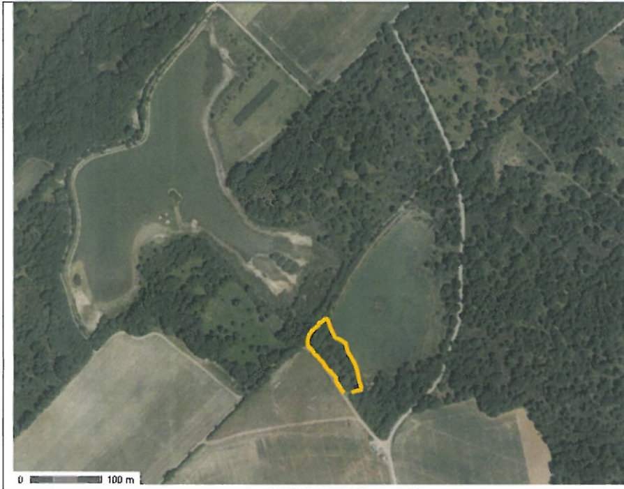
Emprise du projet de défrichement