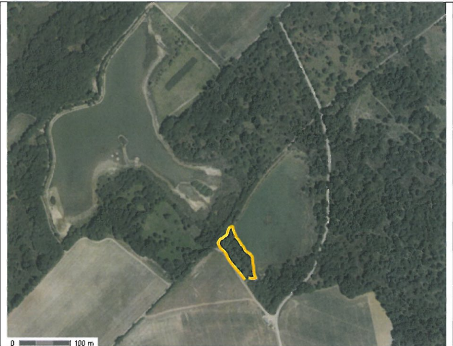
Emprise du projet d'agrandissement de l'étang