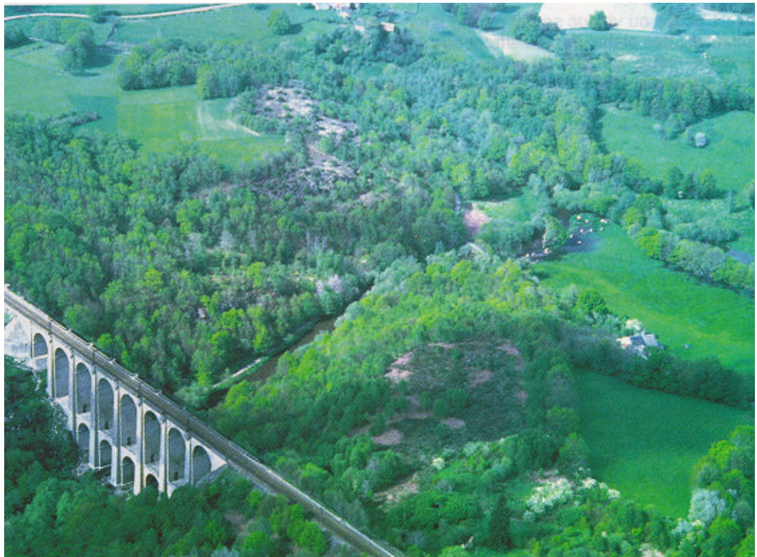
Vue aérienne de la Gartempe et du viaduc de Rocherolles.

La limite en aval du site se situe dans une prairie humide parsemée d'arbres et de blocs de rochers granitiques.