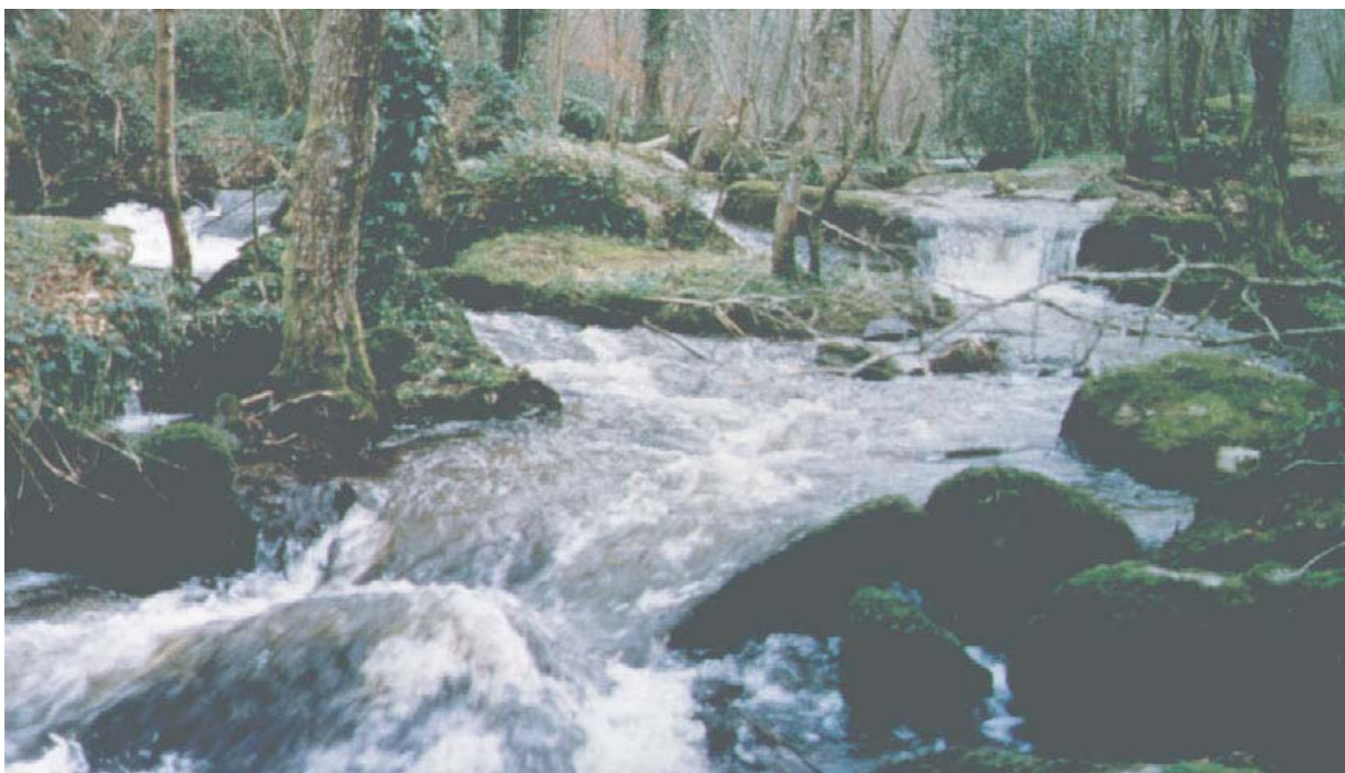
Le cours torrentueux de la cazine

Une ancienne carrière, située près du bourg de Saint-Léger-Bridereix, témoigne d'une époque où l'on extrayait la roche pour les constructions locales. Aujourd'hui couverte de landes, cette entaille dans la roche permet d'en saisir toutes les nuances.