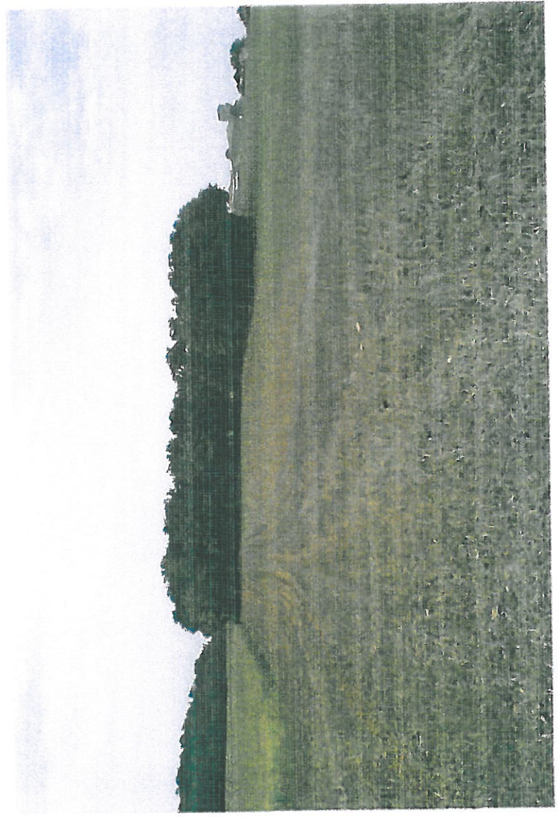
Photo 3 le 26/08/2013 Environnement Proche