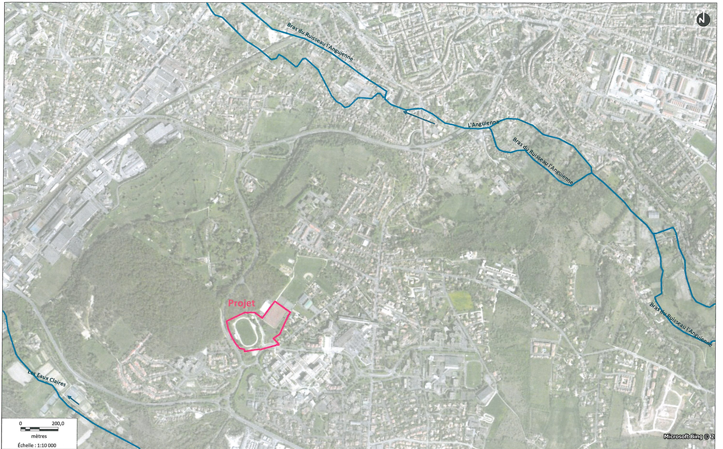
Figure 1 : Vue aérienne du projet et réseau hydrographique avec sens d'écoulement