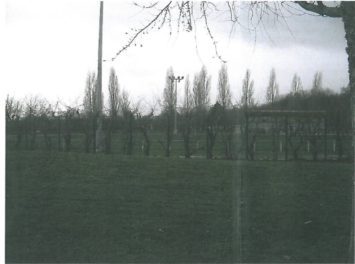
Photo 2 : Vue depuis le centre du projet vers l'ouest – Tribunes (4/02/13)