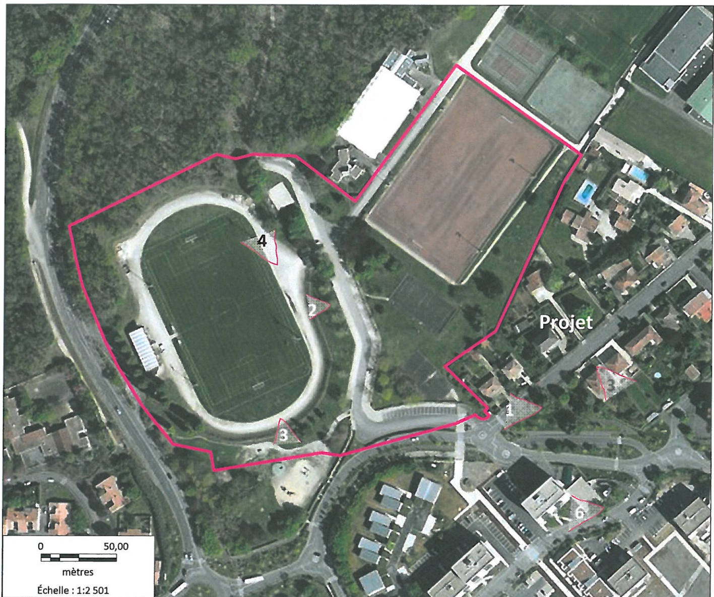
Figure 1 : Vue aérienne du projet et positionnement des prises de vue