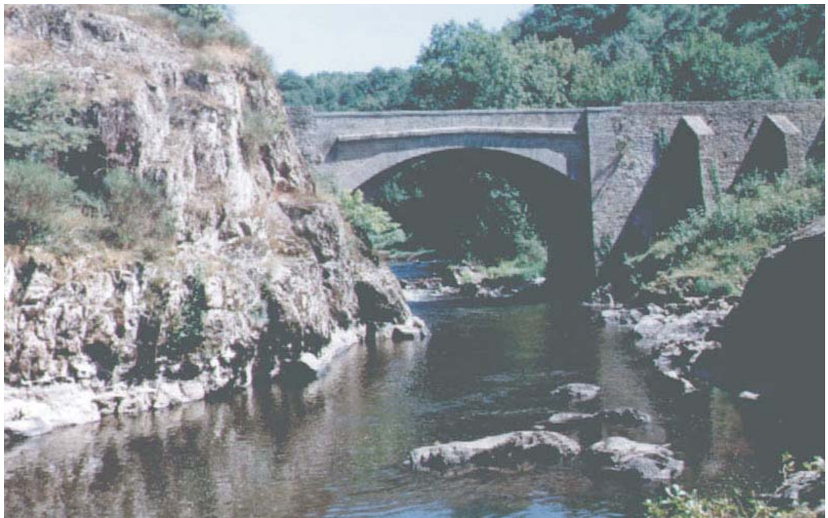
Le Pont du Diable

L'ancienne carrière située sur la rive droite, au bord du CD 14 et en face du moulin, est progressivement recouverte par la végétation, ce qui réduit les effets de son impact visuel.