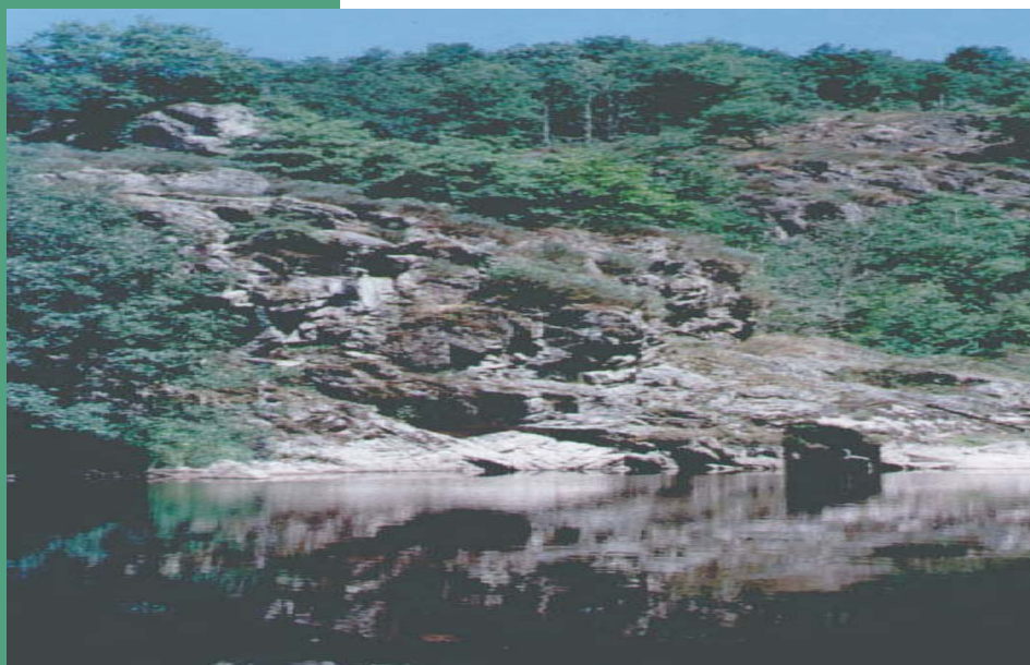
Les gorges d'Anzême