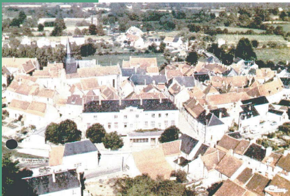
Le centre bourg de Chénérailles

Canton : Chénérailles Commune : Chénérailles Superficie : 15,5 ha Date de protection : 10/02/1977