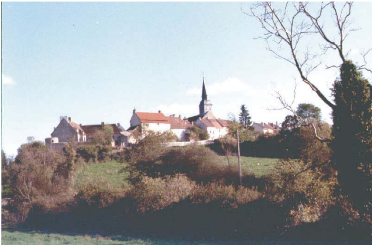
Le bourg et ses abords

(1) Le portail Limousin est caractérisé par une succession de voussures et de piedsroits formant un arc gothique