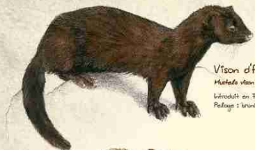
Vison d'Amérique Martes vison Ordre des carnivores Introduit en France depuis un siècle. Pelage : lustré et brillant.