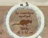
x 3 La musaraigne aquatique Taille : 6 à 12 cm.

POUR PLUS D'INFORMATIONS : Rédigé par : EEF Appui de l'Etat Normand, de la Région Normandie, de la Communauté d'Agglomération Caennaise. En partenariat avec : CDE Collines Normandes, le Centre de Recherches sur le Mammifère (CRM), le Centre de Recherches sur le Mammifère (CRM), le Centre de Recherches sur le Mammifère (CRM). Rédigé par : EEF Cher et André : 02 33 90 00 00 (pour les particuliers) Contact : 02 33 93 85 01 (pour les professionnels)