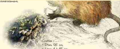
Crottes : - Diam. 0,5 cm. - Long. 4 à 15 cm.

Grève aux dents rouges : la présence de la musaraigne est détectée grâce à l'analyse des paléotes de réflexion de chaux.