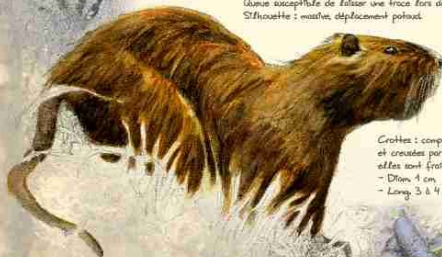
Crottes : composées de débris et crées par des éléments quand elles sont fraîches. - Diam. 1 cm. - Long. 3 à 4 cm.

Myosorex cogus Ordre des rongeurs Introduit en France fin XIX e siècle. Pelage : brun jaunâtre. Moustaches blanches et zone pâle au niveau des oreilles. Queue susceptible de laisser une trace lors de son passage. Silhouette : massif, déplacement potelé.