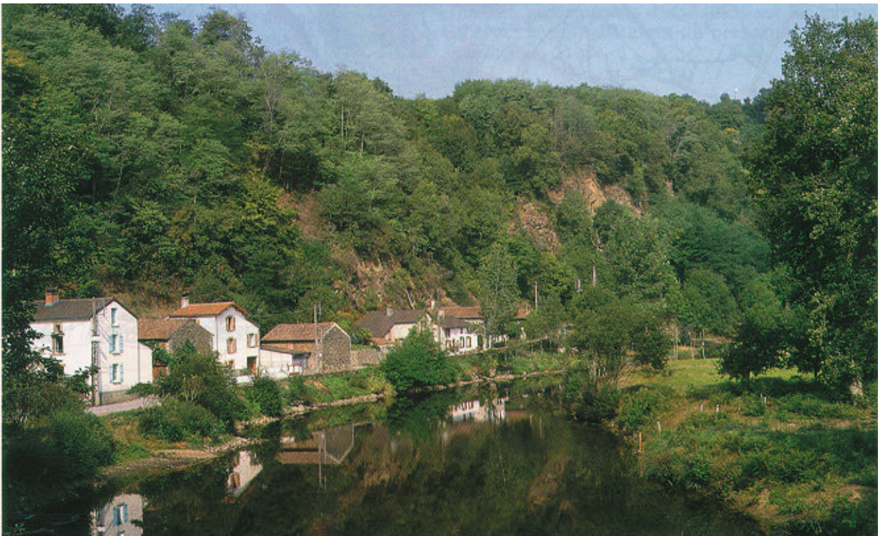
Le pont Saint-Martin, au bord de la Gartempe.

• Les moulins de Gringalet et du Bas Tour : A la sortie d'un méandre, une barre rocheuse fractionnée en blocs de 1 à 2 m de haut crée des chutes dont la principale est semi-