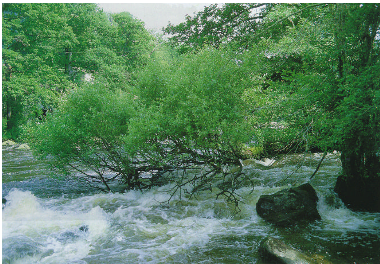
Les rapides de la Gartempe.

Toutefois, la vallée conserve encore sur les versants en pente douce son caractère agricole et devient aussi un secteur touristique facilement accessible par les chemins creux à partir du plateau.