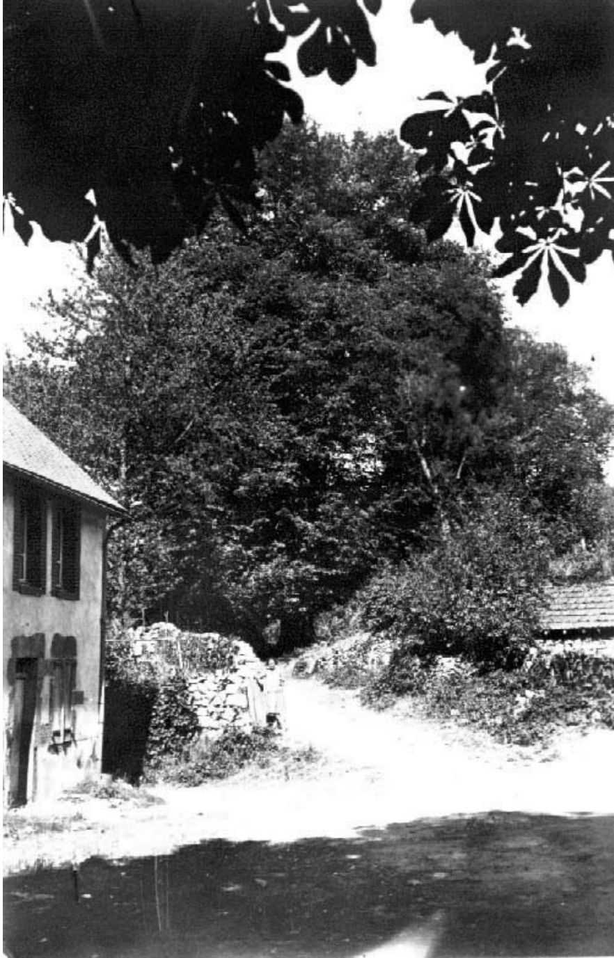
Tilleul des Meaumes -Ancienne carte postale