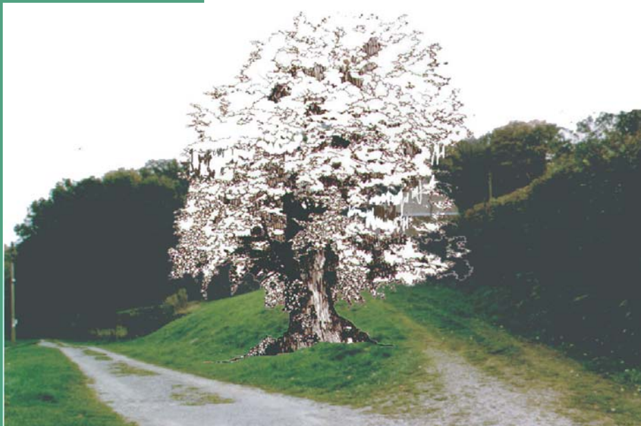
Le tilleul des Meaumes - Photomontage

Canton : Saint-Sulpice-les-Champs Commune : Le Donzeil Date de protection : 31/01/1927