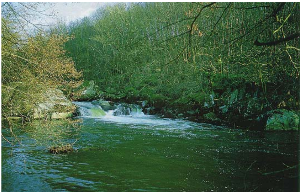
Le saut de la Brame.

Les conditions de promenade dans le site peuvent être améliorées par le remplacement de la passerelle située en amont par une autre plus esthétique et par la recréation d'un passage sur les piles de pierre existant près de la confluence avec la Gartempe. La mise en place de mobilier discret (bancs, poubelles...) compléterait l'aménagement du site.