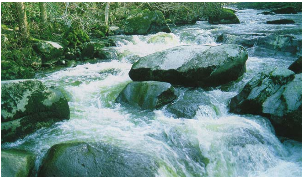
Le saut de la Brame.

Un passage très fréquenté longe la rivière sur la rive droite.