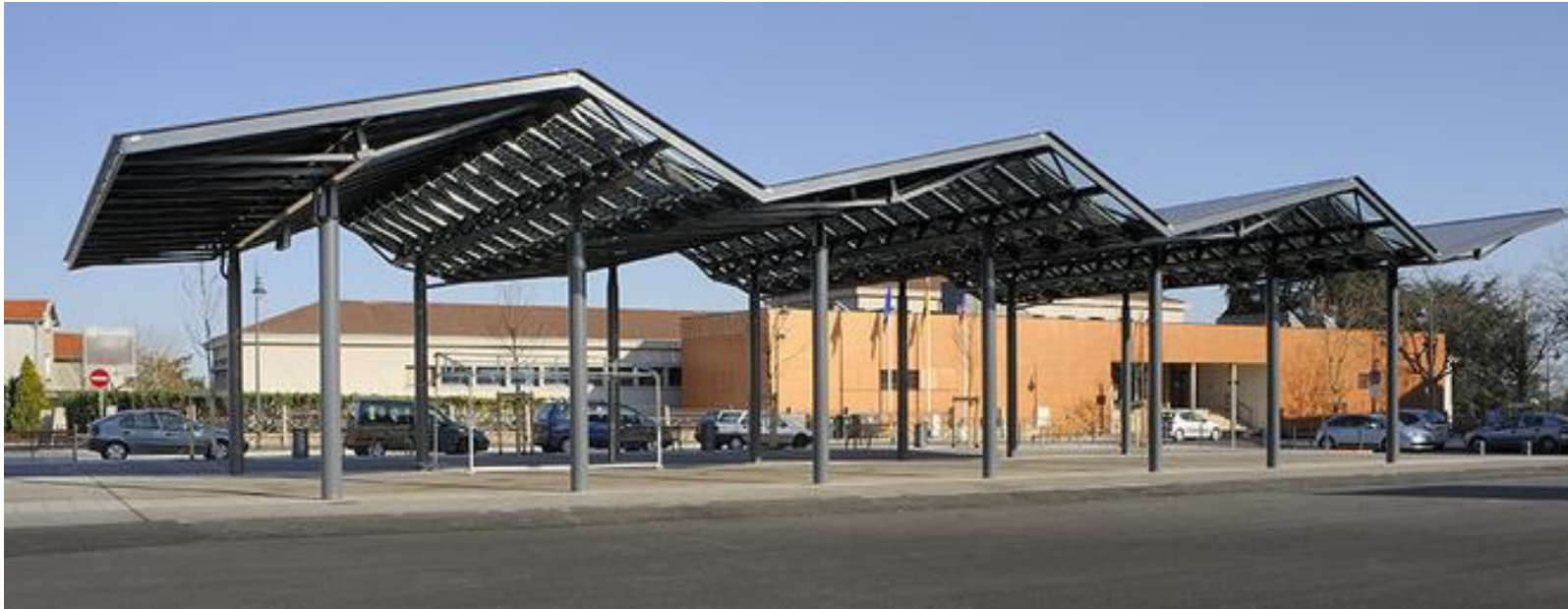
Halle de marché