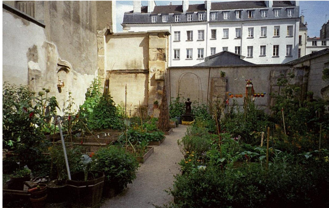
Supports pour plantes grimpantes