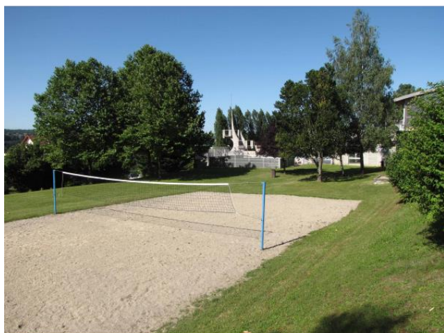
Terrains de beach volley