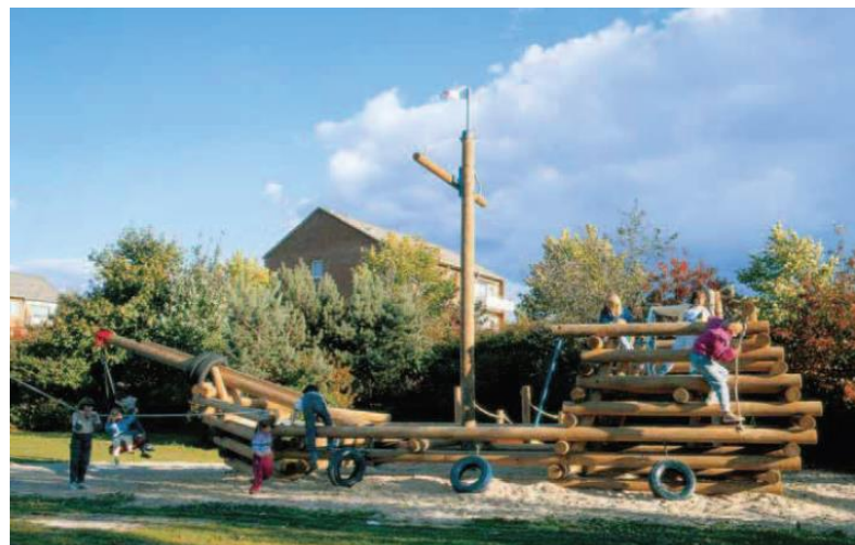
Jeux pour enfants