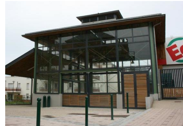
Halle du marché aux produits locaux à Mordelles (35)