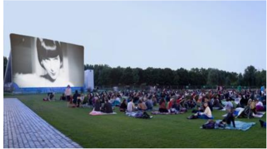
Spectacle de plein air