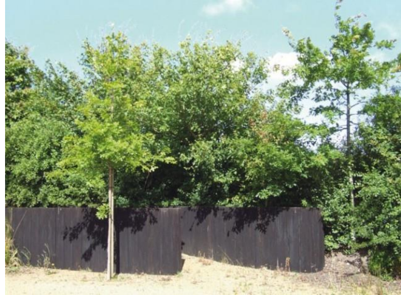
Traverses en soutènement ou clôtures