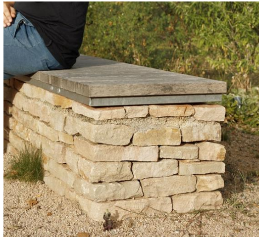
Réutilisation de pierres