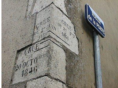
Repères de crues verticaux