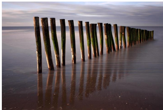
Mur de bouchots