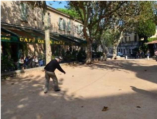
Terrains de pétanque