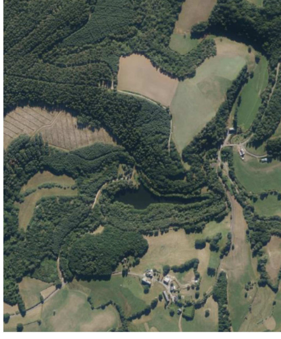
Vue aérienne (Géoportail)

Etant donné la pratique de la pêche sur le plan d'eau, un calcul de la DEAA pour le scénario « ingestion de poissons » doit être réalisé.