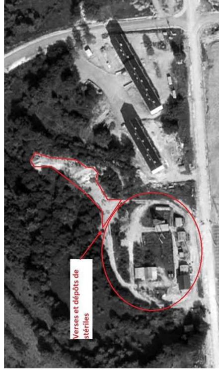
Le site minier de la Vedrenne en 1970