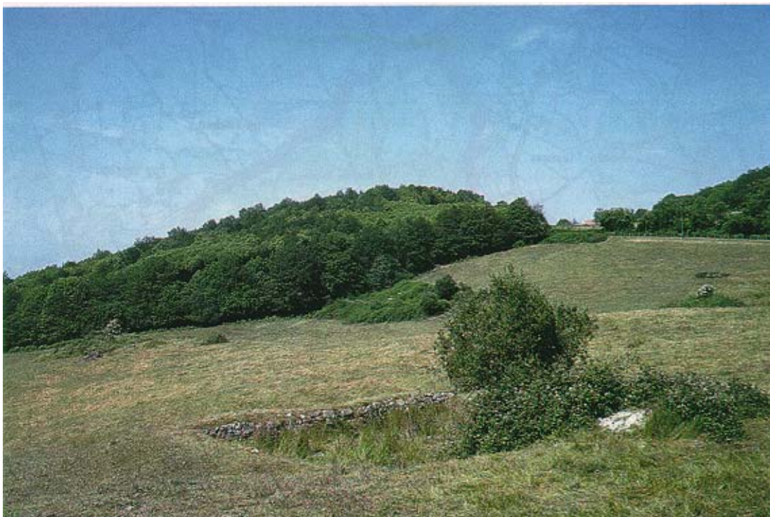
Le village de Courbefy.

On ne trouve plus aujourd'hui que des ruines de la forteresse et des traces de l'oppidum. De l'ancien village subsistent quelques constructions anciennes à usage d'habitation, de grange et hangar. La chapelle, très simple, reconstruite au XVIIème, a remplacé le premier édifice, détruit en même temps que le château.