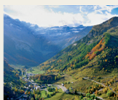
Le Cirque de Gavarnie