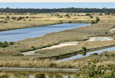
Paysage de marais

L'île se compose de nombreux milieux qui, indépendamment les uns des autres, offrent une grande diversité d'ambiances et possèdent des qualités paysagères certaines. Les milieux forestiers particuliers des contextes littoraux, les marais salants pour certains reconvertis à l'ostréiculture et à l'élevage, l'estran vaseux, les platiers rocheux, les paysages agricoles iliens, sont des milieux pittoresques reconnus.