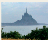
Baie du Mont-Saint-Michel

À la fin du XIX ème siècle, des artistes, des gens de lettres tels que Victor Hugo ou Prosper Mérimée ainsi que les premières associations de tourisme prirent conscience de la valeur patrimoniale des monuments et des sites naturels. Aussi, à la faveur de ce mouvement d'opinion, la loi du 2 mai 1930, intégrée depuis dans le code de l'environnement fut adoptée. Cette législation a pour objet de conserver les caractéristiques du site en le préservant de toutes atteintes à l'esprit des lieux. Au début, ce sont des éléments remarquables qui ont été classés (cascades, rochers, grottes, fontaines, sources, arbres...). À partir des années 1970, le développement de l'urbanisation et des infrastructures entraîne une accélération de la destruction des espaces naturels et agricoles et conduit à classer des entités plus vastes (vallées, montagnes, îles...). L'île d'Oléron est représentative de cette évolution puisque ce sont presque 21 800 ha de paysage remarquable qui ont été protégés par décret du 1 er avril 2011, hissant cette île prestigieuse parmi les paysages les plus emblématiques de la France. A l'instar de l'île de Ré, du Marais Mouillé poitevin, du Mont Blanc, du Cirque de Gavarnie ou des Gorges du Tarn, l'île d'Oléron se place ainsi parmi les plus grands sites français.