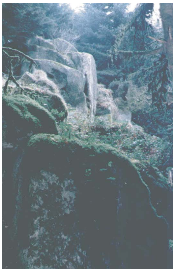
" La Pierre de la Tribune "

Les rochers sont facilement accessibles grâce à des circuits balisés par l'Office National des Forêts.