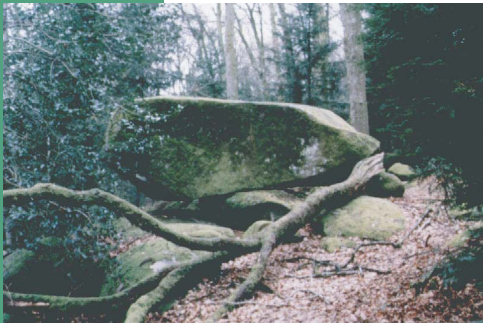
" La Pierre Chabranle "