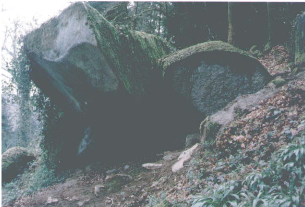
" La Pierre du loup "