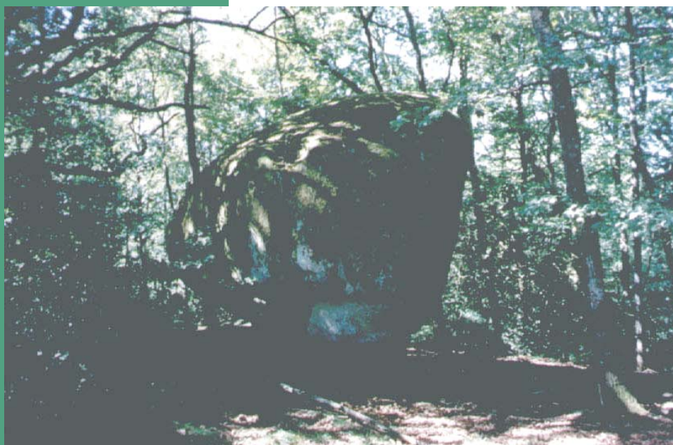
La pierre d'Ep-Nell

Canton : Boussac Commune : Toulx-Sainte-Croix Superficie : 0,4 ha Date de protection : 09/03/1933