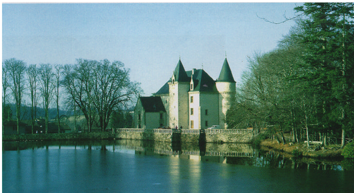
Le château et l'étang.

Le château accueille des manifestations artistiques et le parc est ouvert au public. Un certain nombre d'arbres âgés ont dû être abattus ou vont devoir l'être prochainement. Un schéma d'entretien et de replantation apparaît donc nécessaire pour gérer le parc et proposer des liaisons paysagères avec le bourg.