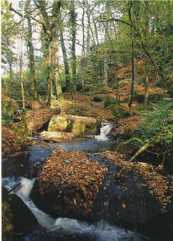
La Couze en aval du Moulin de l'Age.

Une dernière barre marque la fin du chaos rocheux. En aval, la Couze serpente dans une alvéole où se sont accumulés les produits de l'érosion des versants. Cet espace ouvert est occupé essentiellement par des prairies. En limite de la route départementale 50, une motte féodale constitue un site archéologique intéressant.