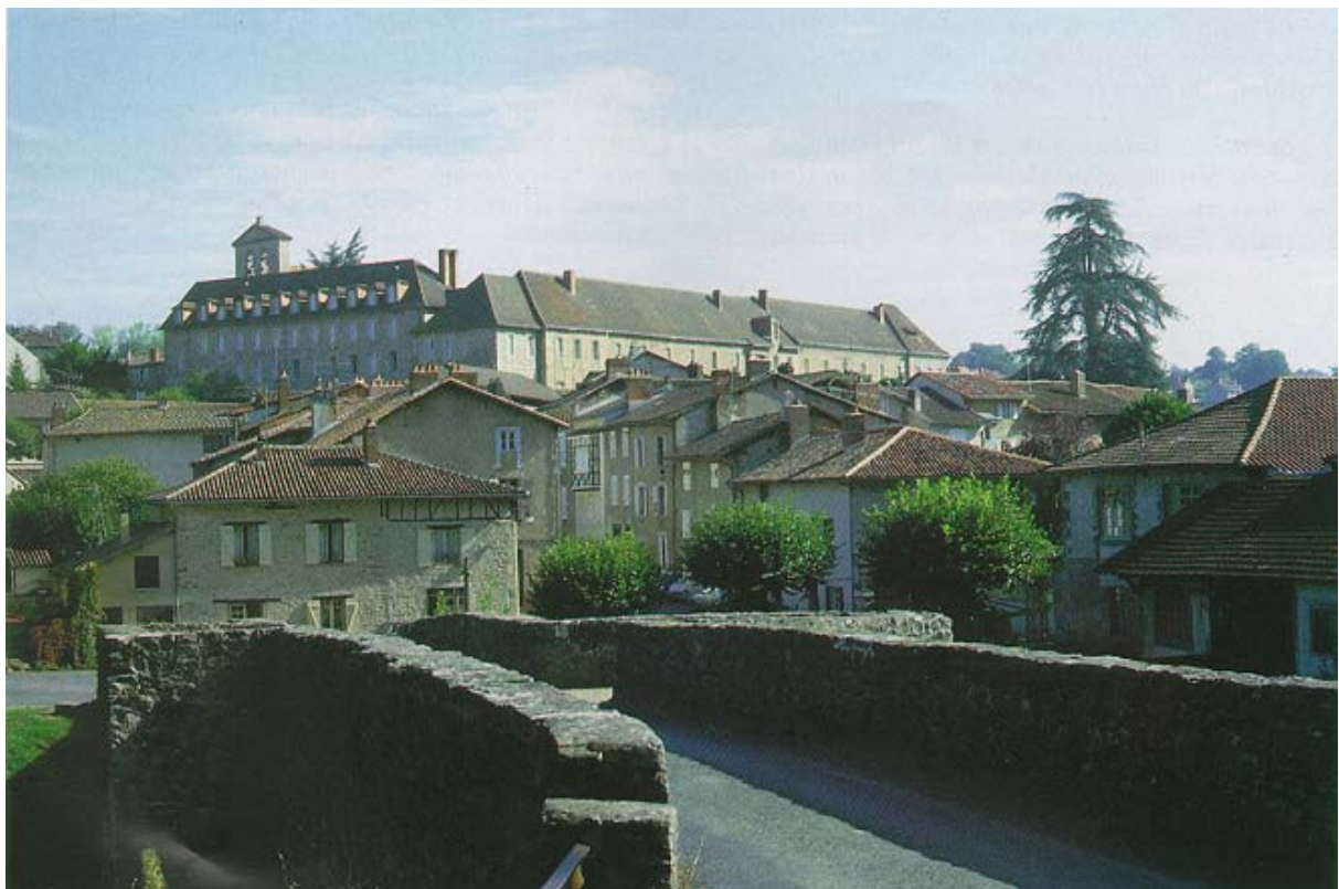
Le pont médiéval et l'abbaye de Solignac.

• L'espace de Solignac est marqué par la silhouette de l'église, ancienne abbatale romane au centre du bourg. L'habitat ancien, homogène est très regroupé le long de la RD 32 qui longe la vallée et la voie qui mène au pont sur la Briance.