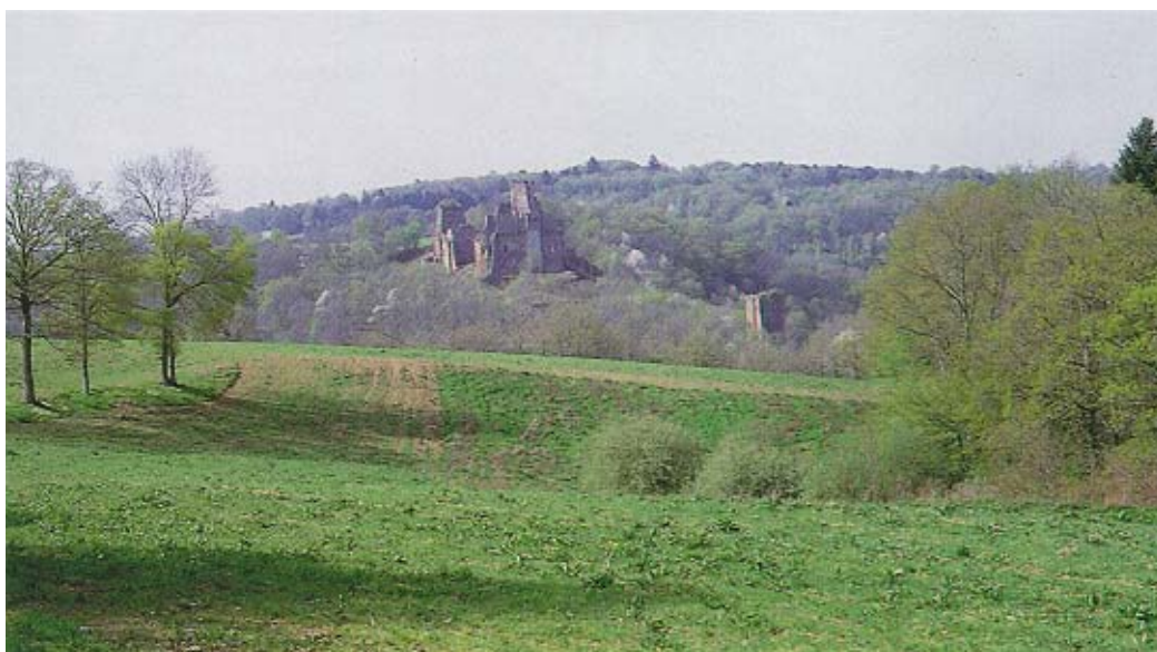
Le site de Chalucet dominant la Briance et la Ligoure.

A la Révolution, les religieux furent expulsés et leurs biens confisqués. L'abbaye servit de prison de religieuses puis accueillit un pensionnat de jeunes filles, et enfin, en 1824,