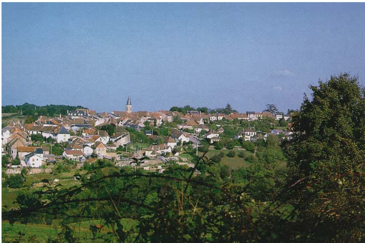
Le bourg de Pierre-Buffière.

Les bourgs de Pierre Buffière et Solignac méritent une mise en valeur, notamment par des incitations à la rénovation des façades, mais aussi par l'aménagement des espaces publics. Les bords de Briance, l'espace du pont à Solignac et la place de la mairie à Pierre Buffière pourraient être traités en priorité.