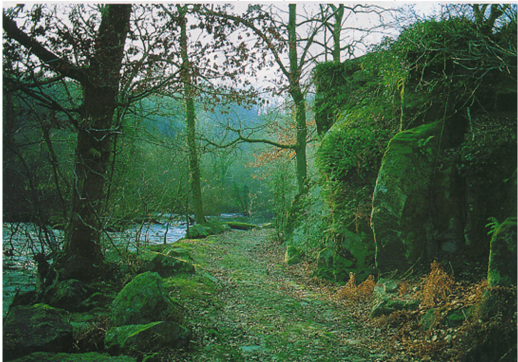
La vallée de la Semme, avec falaise.

Dans la partie protégée du bourg sont juxtaposés quatre éléments forts : l'étang, l'église, le temple et le château. L'église, construite vers 1850 présente un clocher octogonal couvert en bardeaux. Le temple est en moellons ornés de lignes de briques. Par dessus les murets de pierre qui l'entourent, le parc du château se