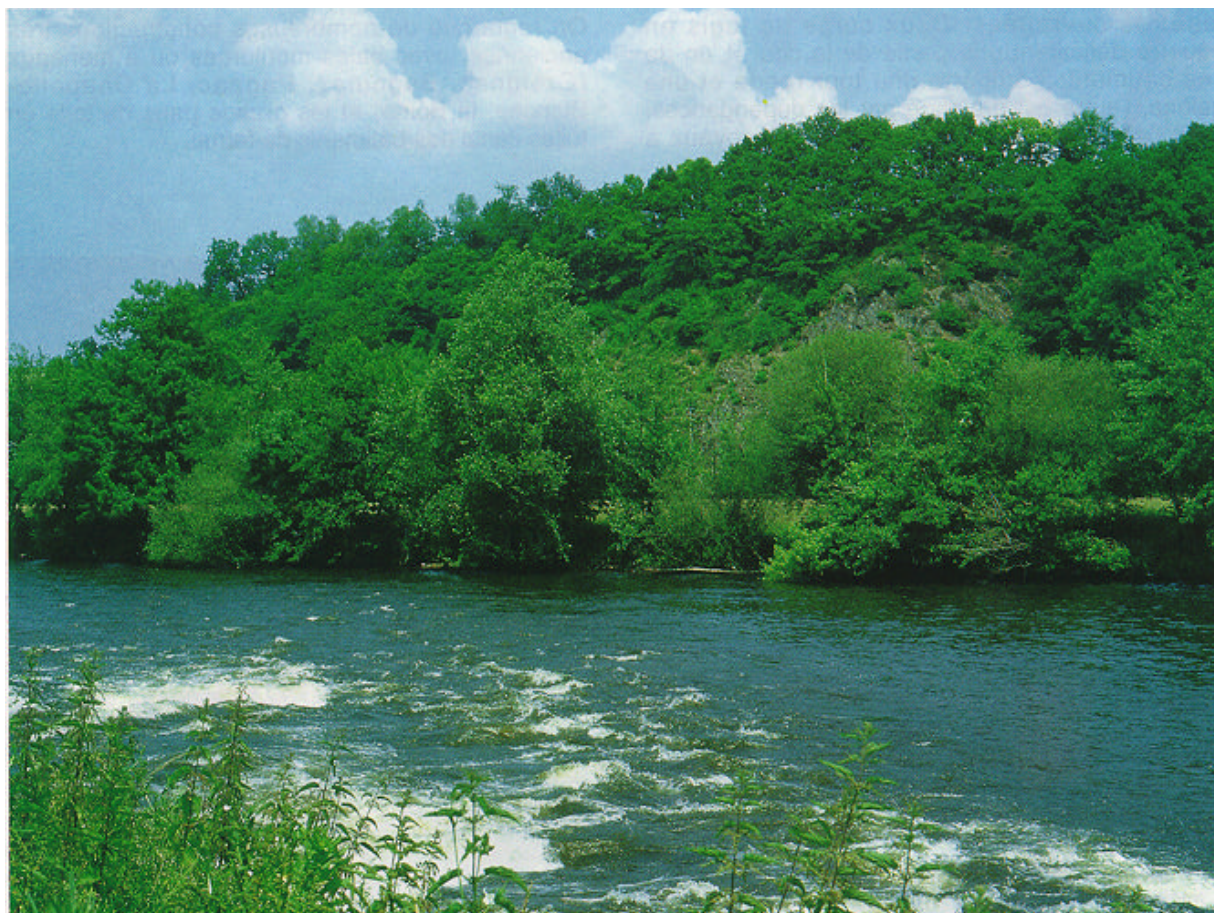
La Vienne au Gué de la Roche.

Le Château de Losmônerie mérite une restauration et ses abords une mise en valeur. De nombreux arbres ont été endommagés par la foudre ou la vieillesse. L'intérêt du site et la fréquentation, déjà importante, demanderaient que soient étudiées des conditions de visite de tout ou partie de l'espace du château (jardins seulement, accès au point de vue sur la Vienne ou visites guidées de l'ensemble certains jours...).