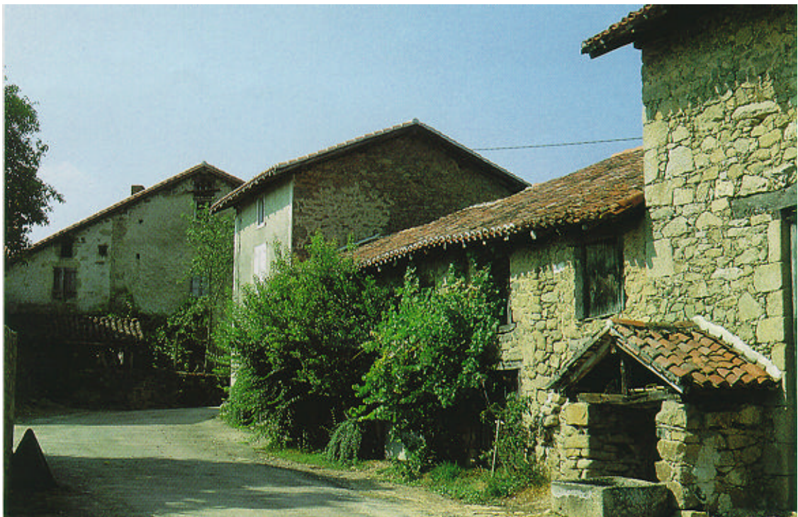
Habitat traditionnel de la vallée de la Vienne.

Les villages sont groupés en rebord de plateau, (La Roche, Saint-Yrieix-sous-Aixe, La-geas, Chauzat, Sainte-Marie-de-Vaux, Le Vignaud, La Chapelle Blanche), quelquefois à flanc de coteau, sur la rive droite, exposée au Sud (Chandiat, Saint-Victurnien). On remarque de nombreuses constructions très anciennes, avec baies moulurées ou à meneaux (Greignac, Bagoulas, Pagnac, La Chapelle-Blanche, la Boine) et les grands pans de toits en tuiles canal des bâtiments de ferme.