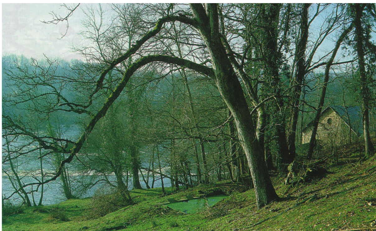
Les abords de l'ancien moulin du Daumail.