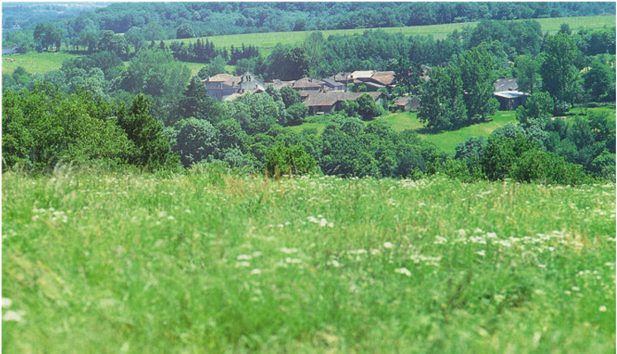
Le bourg de Saint-Yrieix-sous-Aixe.

Les terrasses du château de Losmônerie dominant la Vienne. Construit au XV ème et XVI ème siècles, cet édifice présente une architecture renaissance remarquable par sa galerie ouverte et ses lucarnes, ses portes et fenêtres ouvragées. Deux corps de logis en équerre délimitent une partie de la cour. L'un de ses bâtiments comporte une tour ronde et une galerie, l'autre est prolongé par les dépendances. Tout l'ensemble est couvert de toits à coyaux à quatre pans en tuiles plates.