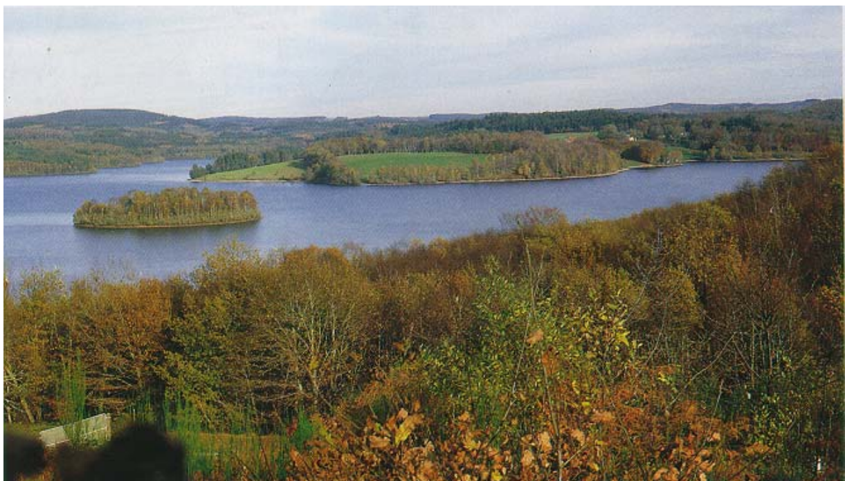
Le lac de Vassivière.

L'intérêt écologique du site : grande étendue d'eau, importantes zones boisées et enclaves agricoles, zones humides, landes à bruyères, est réel. un inventaire Z.N.I.E.F.F. a été effectué pour l'ensemble du lac et des berges.