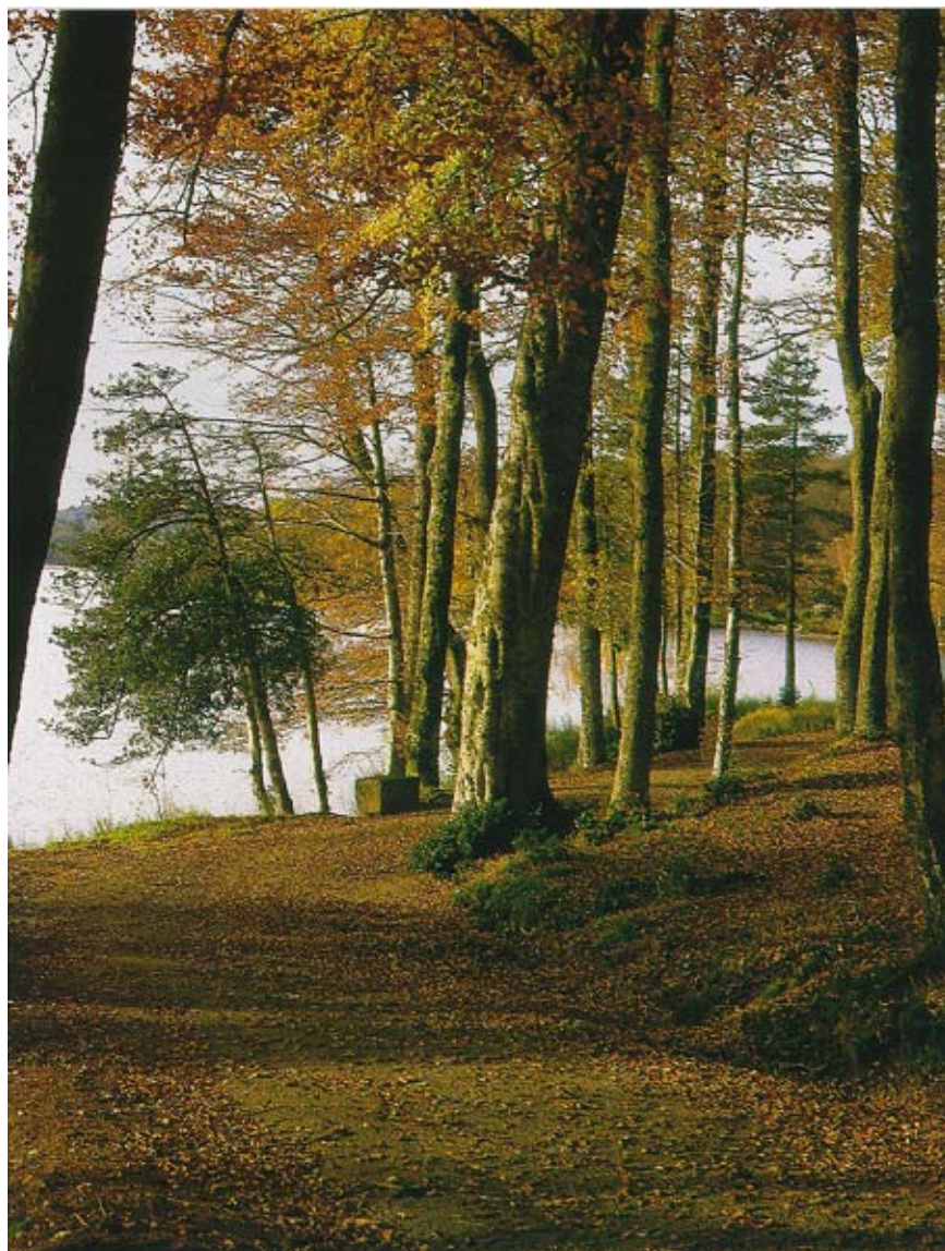
Le sous-bois de l'île de Vassivière, en automne.