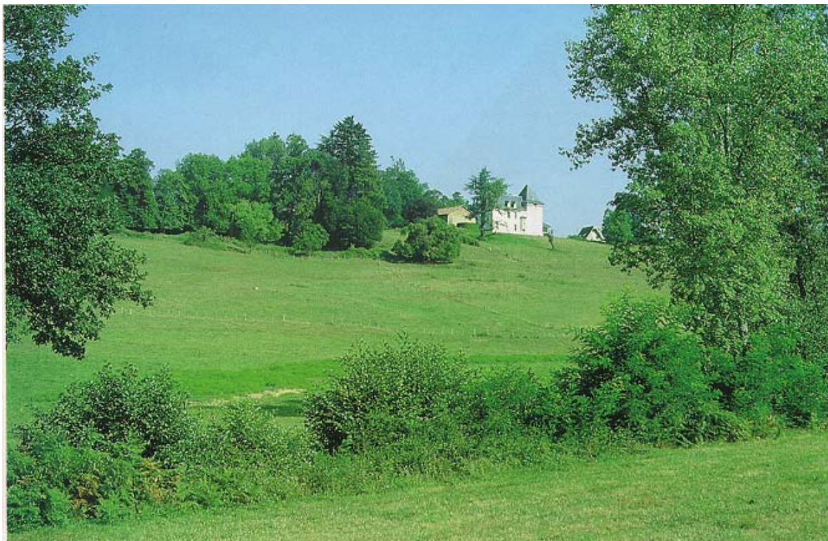
Château de Reignefort.

A Beauvais, le château, du XVIIIème classé Monument Historique, qui servait de maison de campagne aux abbés de Saint Martial de Limoges a été construit par Joseph Brousseau. La pièce d'eau située à l'Ouest , devant une terrasse plantée de