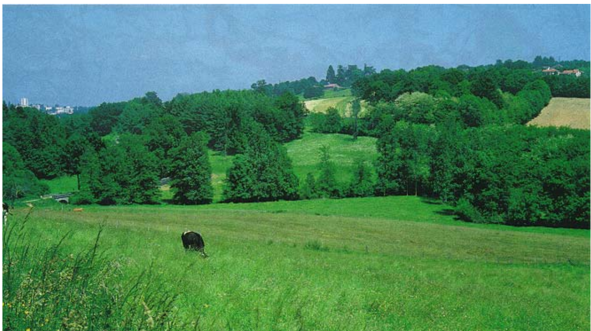
A l'est du mas de l'Aurence.

L'alternance des espaces aménagés autour des châteaux (abords immédiats traités en parcs au XIXème ou réaménagés à cette époque) et des espaces plus naturels (bois et zones agricoles, encore délimitées par de grands chênes) constitue l'élément structurant de ces paysages. Cette organisation n'est pas perceptible depuis les voies principales qui sont soit transversales aux vallées soit éloignées (R.D.79) soit bordées de zones récemment bâties (Villefélix entre Texonnières, le Buis et le Mas de l'Age).