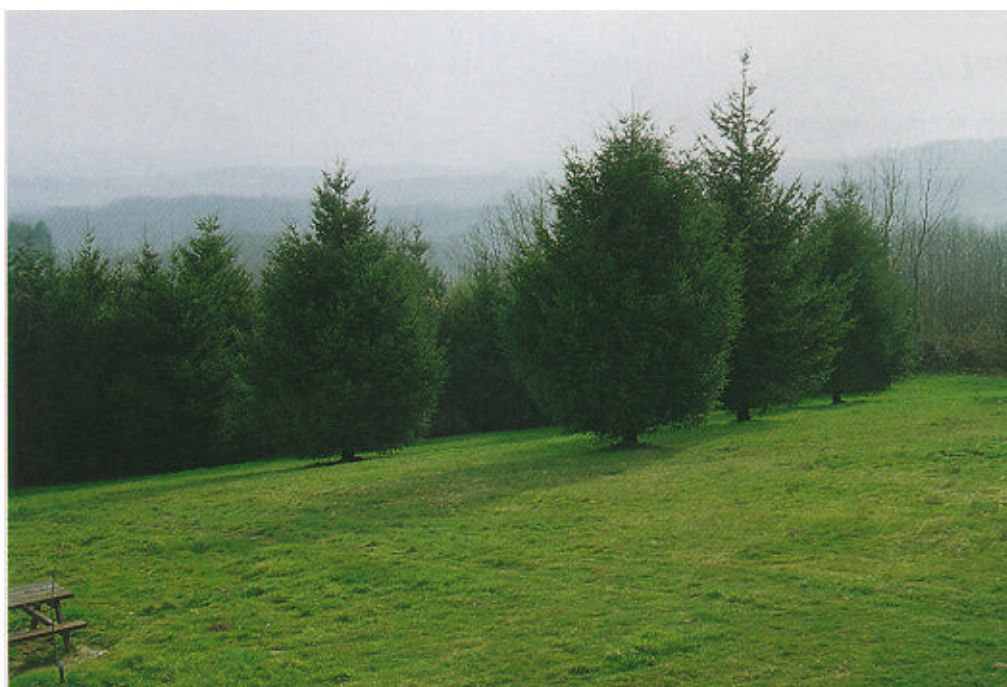
Le point de vue du Grand Puyconnieux.

L'enrésinement, qui menaçait la pérennité du panorama, a été stoppé mais le développement des arbres, dans les parcelles plantées avant la protection au titre des sites, commence à être gênant.