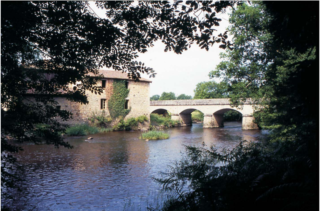
Le pont et le moulin du Pont de Gartempe.

Le pont et le moulin de la Gartempe marquent un seuil entre le paysage boisé, rocheux, relativement fermé de la vallée et celui très ouvert, de caractère bocager en aval du périmètre de protection. Ce lieu stratégique positionné dans un évasement de