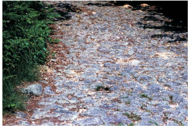
La voie romaine.

vallée, le bourg médiéval de Châteauponsac livre en contre-plongée sa fine silhouette composée d'une juxtaposition de façades diversifiées. Le clocher de l'église Sainte Thyrese, renforce le caractère du saisissant panorama. Autrefois fortifié, cet édifice roman du XI ème siècle, classé monument historique en 1910, occupe une situation stratégique. Au pied de la "paroi" de façades, évoquant la vocation défensive initiale du promontoire, un étagement de murs en pierre soutient des jardins en terrasse qui créent un socle travaillé d'une rare qualité. Plus bas, près de l'eau, se dévoilent successivement un grand lavoir couvert, l'ancien moulin Theillaud réhabilité en résidence secondaire et les usines Rousselot désaffectées puis transformées en habitations principales. Très en amont du pont, le moulin Gallant, récemment restauré et une habitation ancienne complètent ce chapelet de bâtiments nés d'un lien étroit avec la rivière. Enfin en aval, de l'autre côté de l'amphithéâtre, des bâtiments d'accueil touristique - issus d'un nouveau rapport à l'eau - ont investi les pentes plus douces. Leur implantation diffuse, leur architecture et leur couleur dénotent dans le paysage. De même, l'habitat pavillonnaire des faubourgs dessert fortement l'harmonie des lieux par son