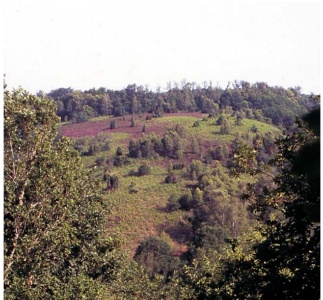
Lande des Piliers de Lascoux.

Toutefois quelques points de vue dominant la vallée permettent encore de saisir la dimension pittoresque du site : villages anciens, blocs rocheux étagés sur les versants, méandres de la Gartempe, découpe douce des lignes de crêtes ou rares prairies préservées dans les portions plus évasées de la vallée. Plus particulièrement, un point de vue aménagé sur la colline Saint Martial, s'ouvre sur le remarquable paysage du promontoire de Châteauponsac.