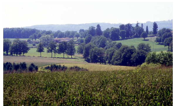
Domaine de la Bouchie

cadencé par les modelés de terrains créés pour franchir le fond du vallon, et grimper rapidement au sommet de la colline. Elle surplombe d'abord des prairies humides arrosées par le ruisseau du Grand Rieu. Plus haut « l'allée-digue » se change en chemin creux. Elle s'enfoncé entre deux hauts talus qui cadrent fortement la perspective sur la cour d'honneur de la maison de maître entourée de son parc paysager du XIXe siècle. Les chênes, ainsi plantés tantôt en surplomb, tantôt en contrebas du chemin accompagnent les variations de l'allée. L'allée figure sur un plan terrier de 1617 conservé au domaine, ainsi que sur un plan de 1818 levé par Julot Tourniol.