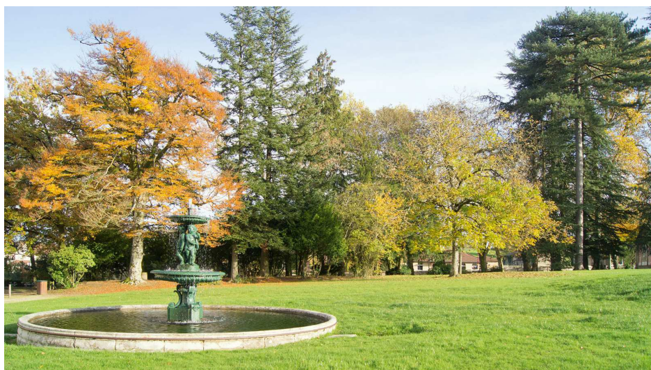
La fontaine des Marmousets dans le parc

Le château et le parc ont été rachetés en 1983 par la commune pour les transformer en mairie, en parc ouvert au public et afin de développer le centre équestre. Nexon est également devenu un site réputé pour le cirque dont les chapiteaux se sont implantés dans la partie sud du parc. S'est développée en 1996 une expérimentation de jardin social, dit « passerelle entre les générations ou Jardin des sens ». Il se situe à l'angle nord-ouest du parc, à proximité de l'ancien lavoir.