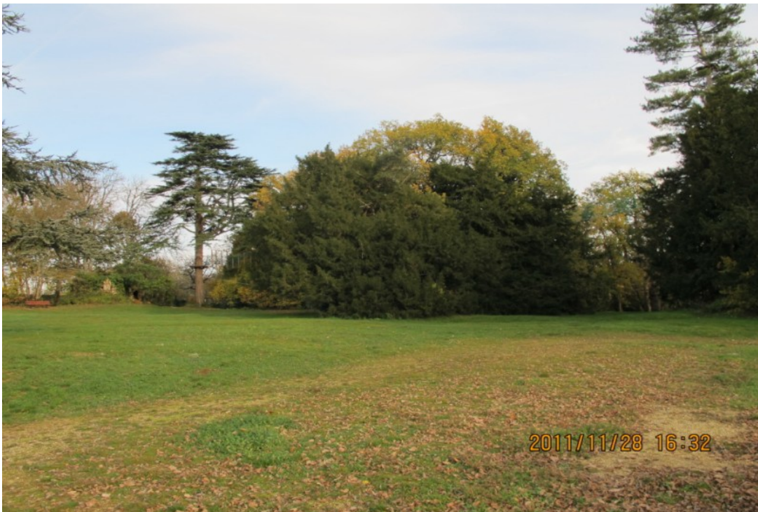
Photo 11 Vue sur le parc du Gravion situé en plein centre-ville, sur un oppidum dominant l'abbaye de Saint-Benoît, la vallée du Miosson à l'est et celle du Clain à l'ouest. C'est un lieu très fréquenté à côté des écoles, il a un parcours accrobranche très intégré.