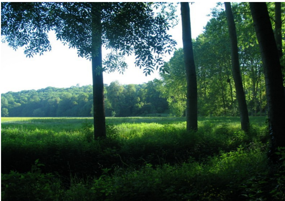
Photo 4 Vue d'ouest en est de la vallée du Clain à Saint-Benoît au même endroit.