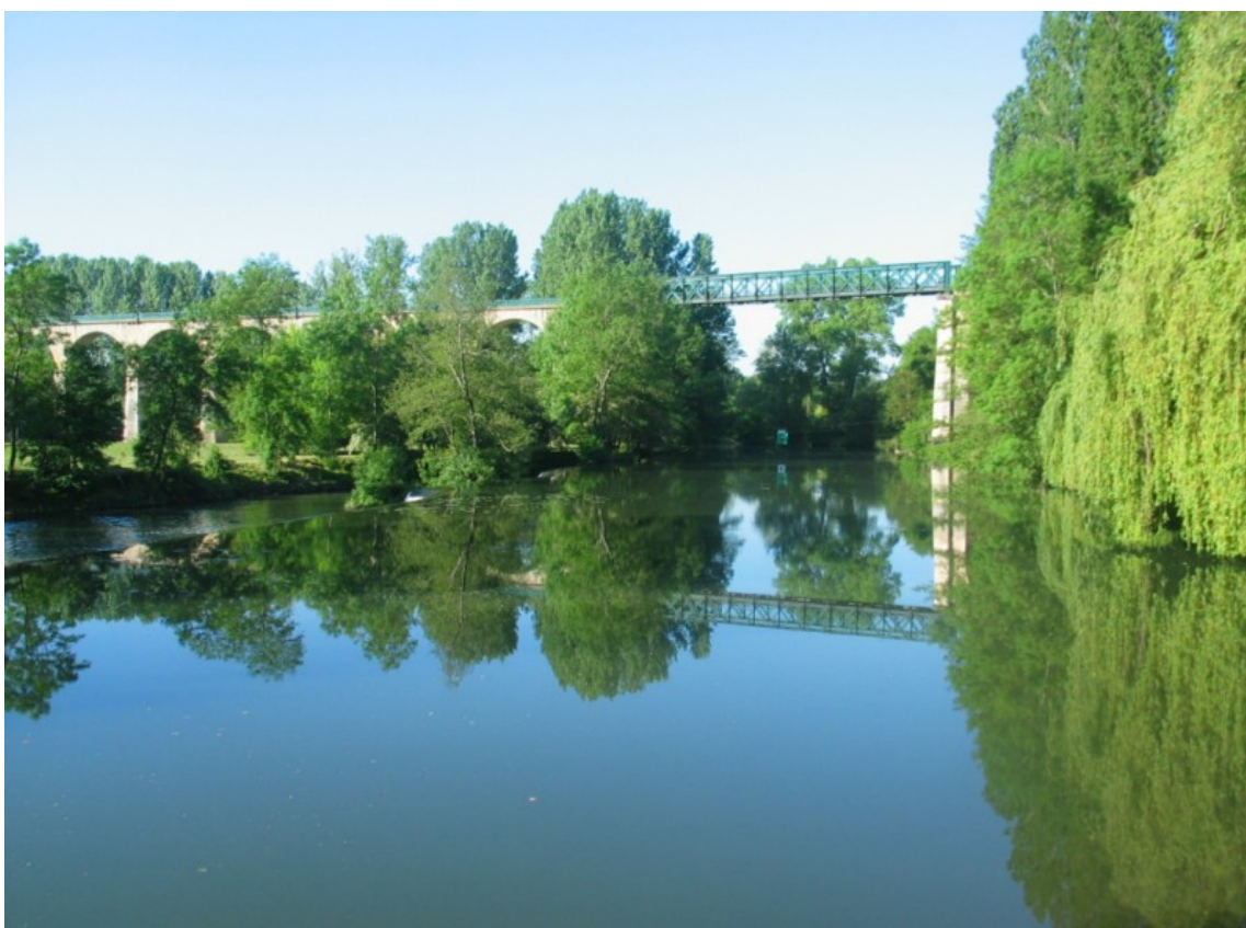
Photo 5 Vue nord -sud Vallée du Clain sur le viaduc du chemin de fer à voie métrique.