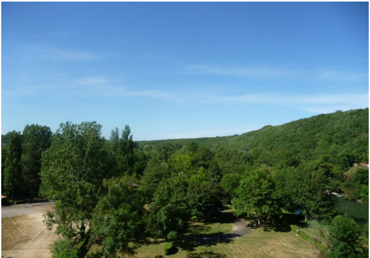
Photo 7 Vue nord sud de la vallée du Clain à partir du viaduc de Saint-Benoît, au fond les boisements de Ligugé dominant la vallée de la Menuse.