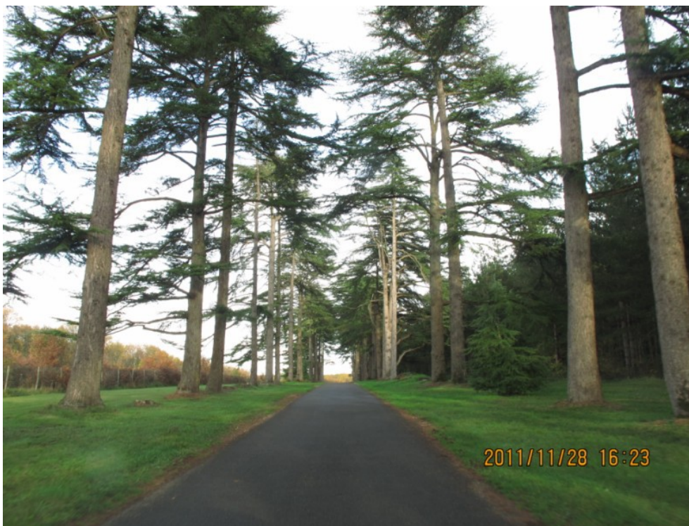
Photo 20 Vue sur l'allée de cèdres conduisant à l'abbaye Sainte Croix, dépendance de l'évêché de Poitiers, comprenant que des bâtiments récents pour séminaires.