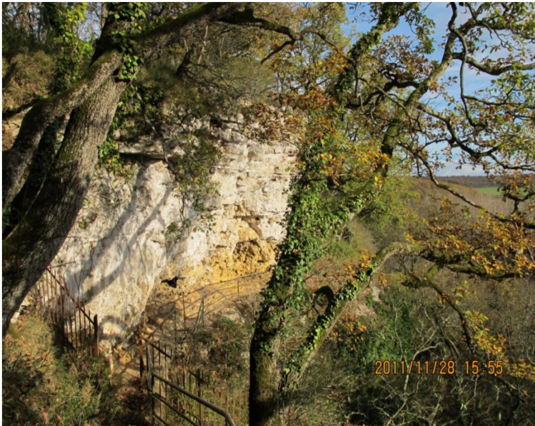
Photo 19 Vue sur le site inscrit des falaises de la Grotte de Passelourdin ( 31 mai 1932).