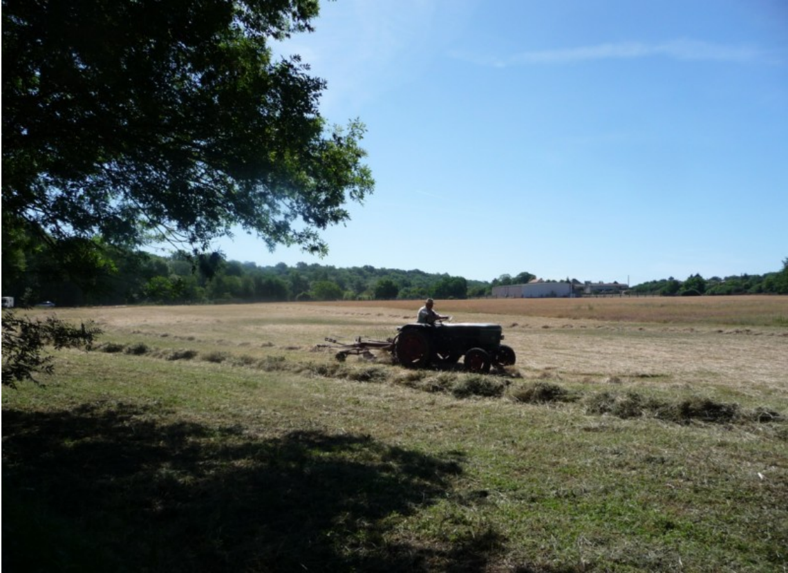
Photo 15 Vue nord sud sur la « Varenne » prairies en cours de fenaison en rive gauche du Clain, une ambiance particulièrement champêtre en pleine agglomération.