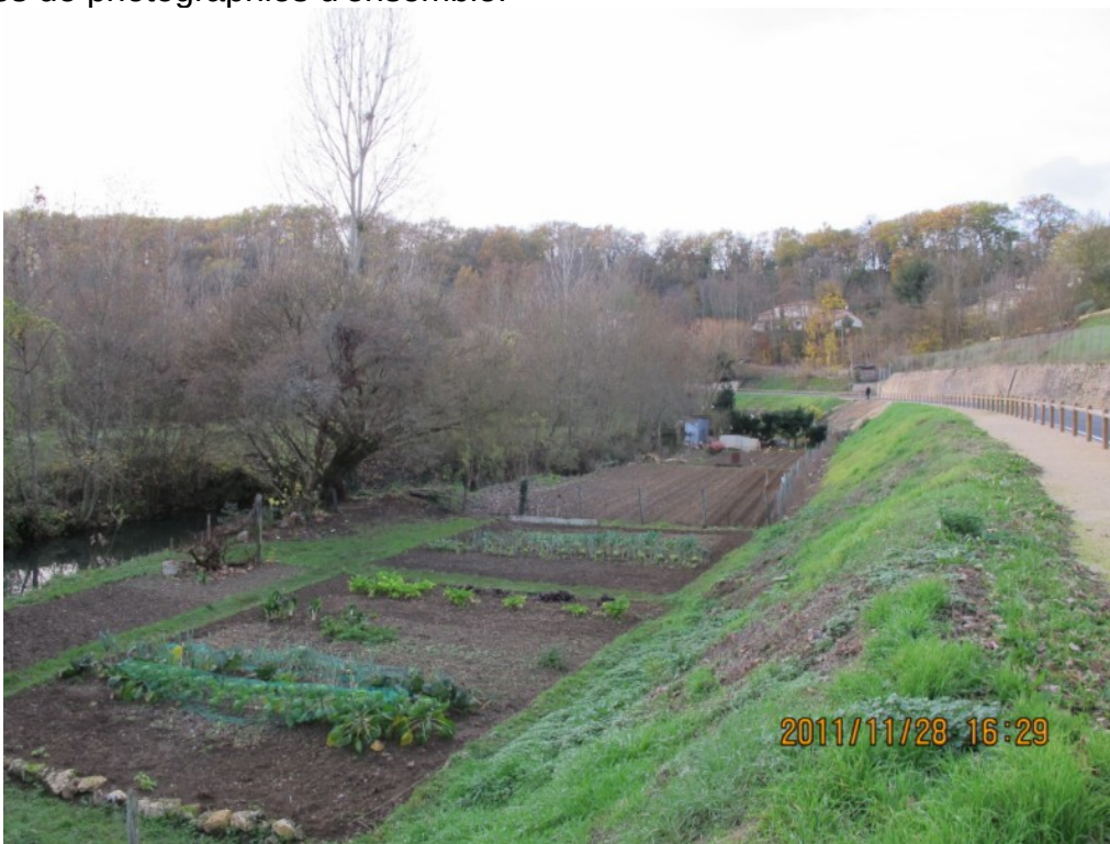
Photo 22 Vue sur la vallée du Miosson dans Saint Benoît entre la RD 741 et le bourg, au fond sur la hauteur l'espace boisée du parc du Gravion.