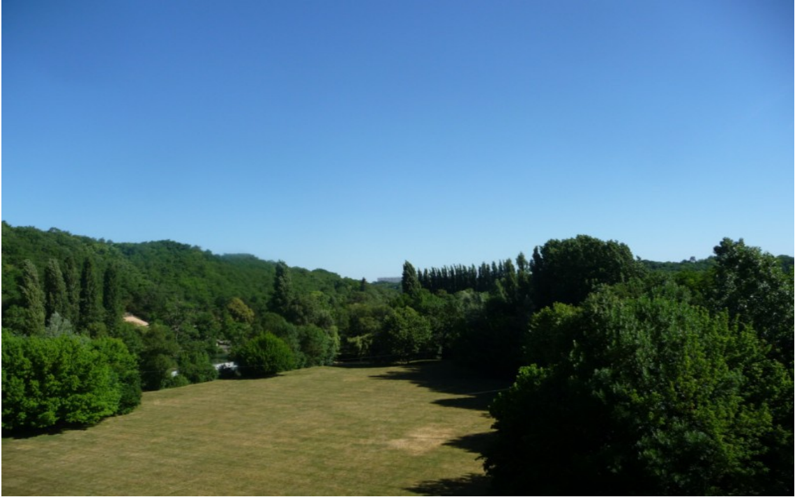
Photo 6 Vue sud-nord de la vallée du Clain à partir du viaduc de Saint-Benoît.