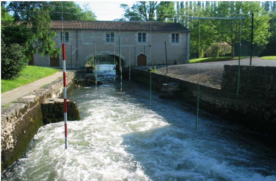
Photo 16 Vue sud nord sur la base de canoé kayak de Saint-Benoît dans un ancien moulin restauré.