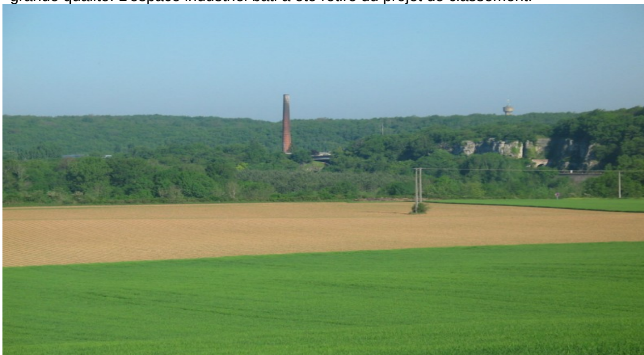
Photo 9 Vue sur la façade sud de Saint-Benoît et sur le site inscrit des falaises de la Grotte de Passelourdin (31 mai 1932). Au centre la vieille cheminée de l'ancienne usine chimique aujourd'hui dépolluée, devenue Quadripack, lieu de recherche et de fabrication de produits d'entretien écologique. Le Clain coule derrière l'usine, au fond les bois de Ligugé compris dans le périmètre du projet de classement.