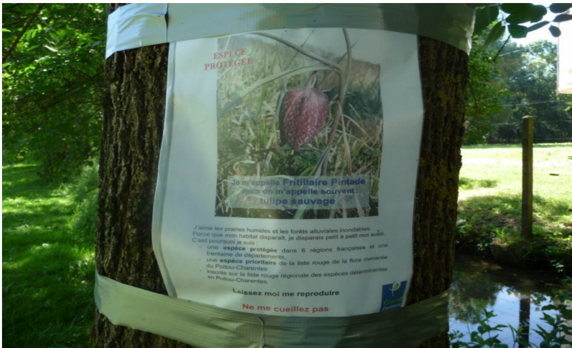
Photo 14 Au même endroit information du public et des nombreux randonneurs qui fréquentent cet espace sur l'importance de la flore et de la fritillaire pintade en particulier, plante protégée dans de nombreuses régions et sur la liste rouge en Poitou-Charentes.