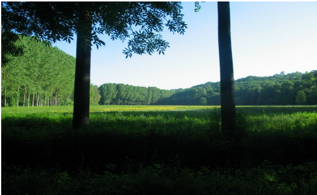
Photo 3 Vue sud-nord de la vallée du Clain au coeur de Saint Benoît : grandes praires humides en fond de vallée, coteaux boisés, avec l'arrivée du Miosson qui coule au premier plan et au pied du talus de la voie ferrée Paris Bordeaux le long de la rangée de peupliers. C'est un espace d'une exceptionnelle qualité.