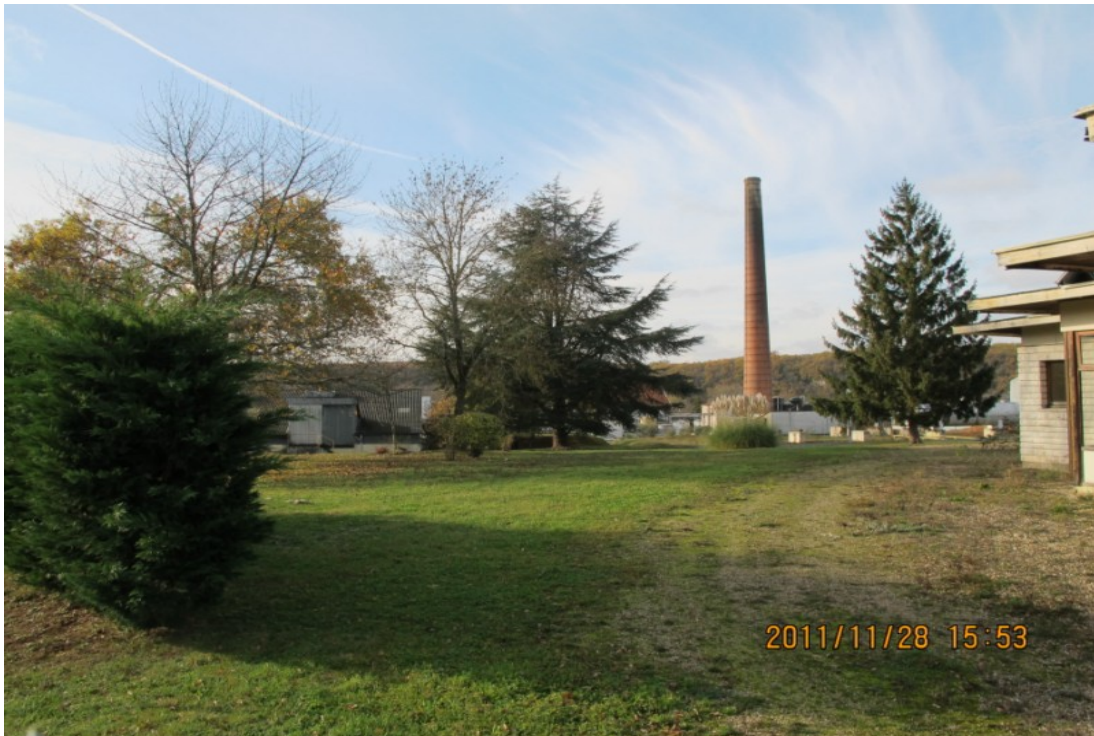
Photo 18 Vue sur la cheminée de l'usine Quadripack à Passelourdin, hors classement.