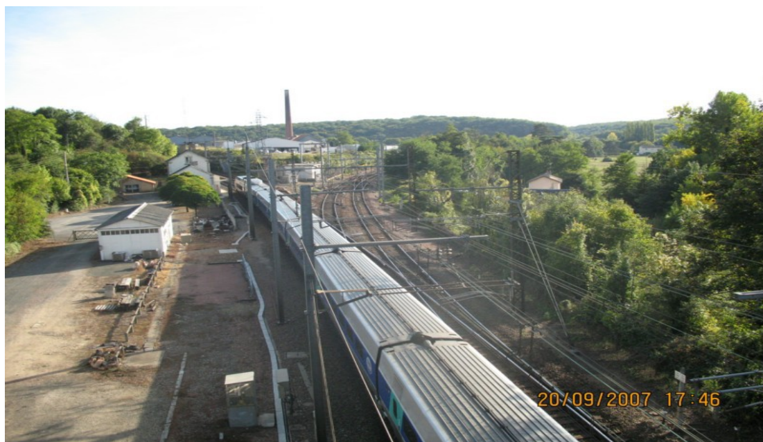
Photo 8 Vue nord-sud à partir du viaduc de Saint-Benoît de la vallée du Clain avec vue sur l'embranchement de la voie ferrée Paris Bordeaux à gauche et Paris La Rochelle à droite qui emprunte la vallée de la Menuse. Entre les deux voies ferrées se trouve l'usine Novamex Quadripack, site « historique » du premier aérosol européen fabriqué industriellement après guerre. L'usine fabrique actuellement des produits biologiques de grande qualité. L'espace industriel bâti a été retiré du projet de classement.