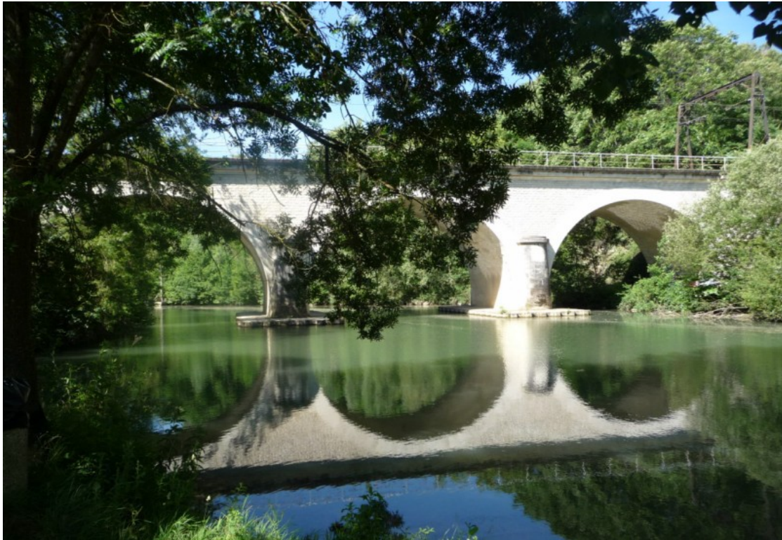
Photo 12 Vue sur le pont SNCF Paris Bordeaux au niveau de la Varenne à Saint-Benoît.