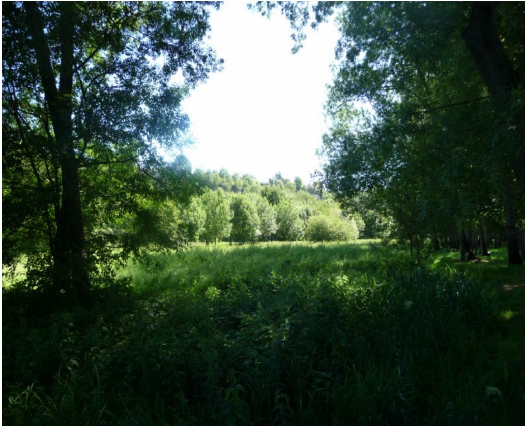
Photo 13 Vue nord-sud en rive gauche sur une prairie humide en fond de vallée au niveau de la Varenne, le Clain coule à gauche sous les falaises de la Mériçote.