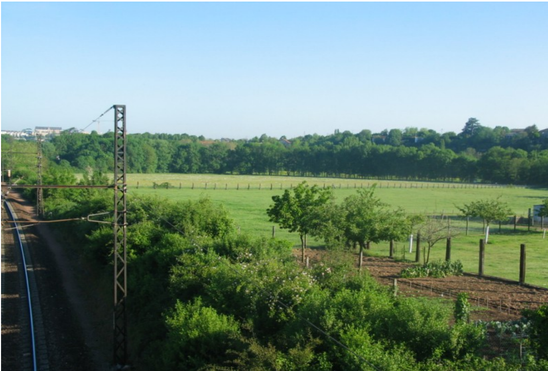
Photo 2 Vue sur la « Varenne » à Saint-Benoît délimitée à gauche sur la photo par la voie ferrée Paris Bordeaux et à droite par les falaises de la Méricote. On voit à l'horizon la ligne de bâti le long de l'avenue de la Libération à Poitiers.