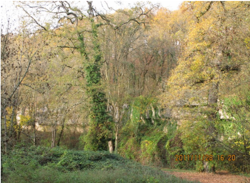
Photo 21 Vue sur la vallée du Miosson au niveau de la « Cadouillère » et les petites falaises situées sous la voie de chemin de fer Poitiers Limoges ; cette vallée en amont de Saint-Benoît est relativement encaissée, très boisée et difficile d'accès. Elle offre peu de possibilités de photographies d'ensemble.