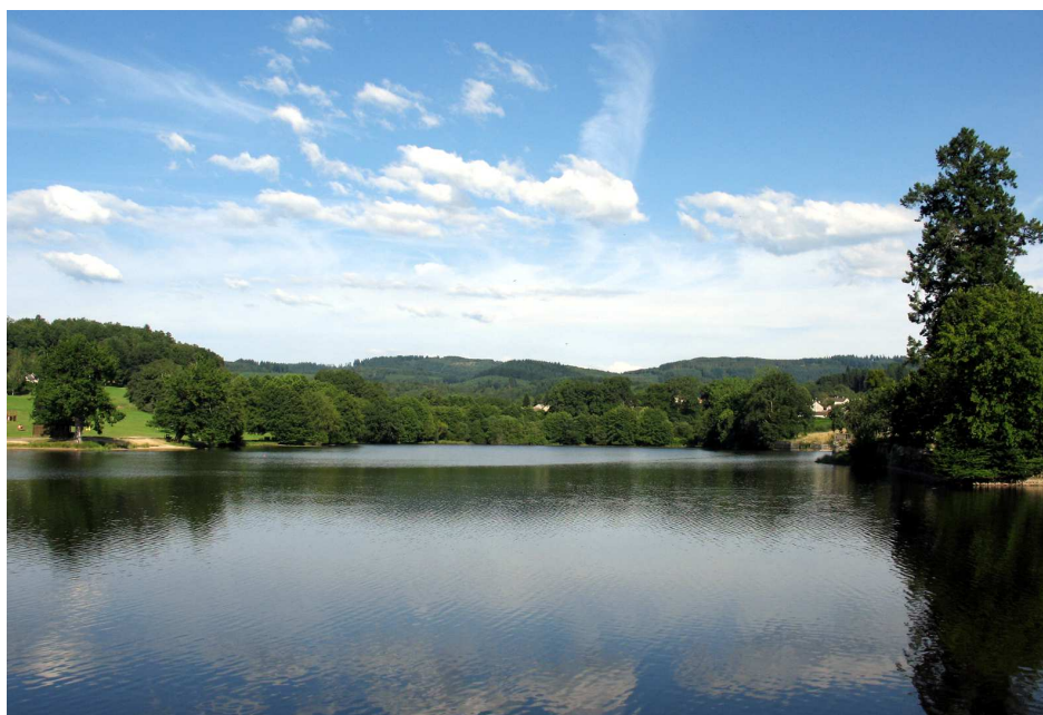
L'étang de Peyrat

Le point de vue sur le bourg depuis la rive nord est d'une qualité certaine. Il permet en effet d'admirer les bâtisses anciennes se reflétant dans l'eau, dominées par le faite en ardoise de la haute tour féodale et le clocher de l'église, plus saillants. L'étang, calme, baigne le pied des maisons clairement soulignées et mises en valeur par leurs murs de soutènement en pierres.