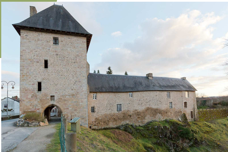
La tour carrée-porche

Cet ensemble constituait, avec la tour de forme carrée et le moulin édifés au XVe siècle, le centre féodal de Peyrat-le-Château.