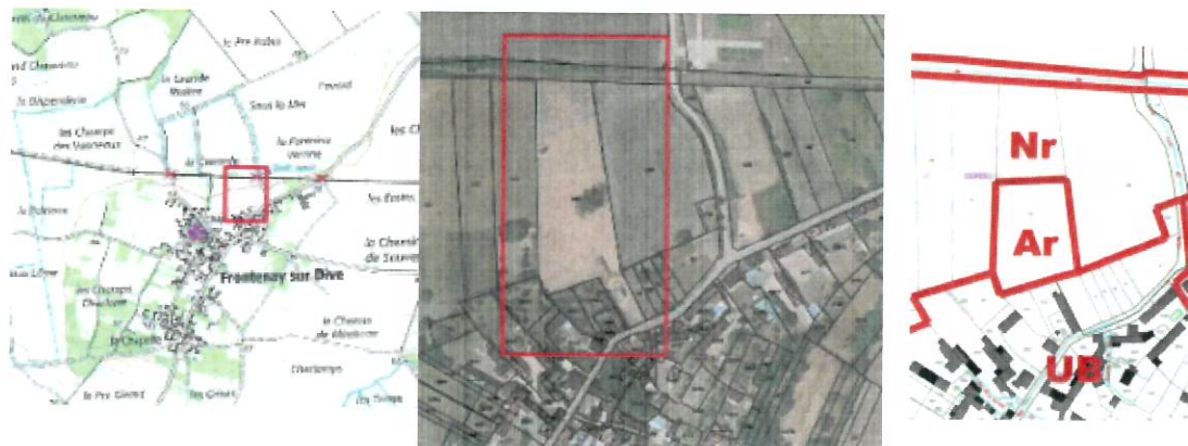
zonage après révision – parcelle 101YK

Le Code de l'urbanisme dispose que certains PLU doivent faire l'objet d'une démarche d'évaluation environnementale, en vertu de l'article L. 121-14, de façon systématique ou après un examen au cas par cas de l'autorité environnementale selon les modalités définies à l'article R. 121-14-1 du Code de l'urbanisme.