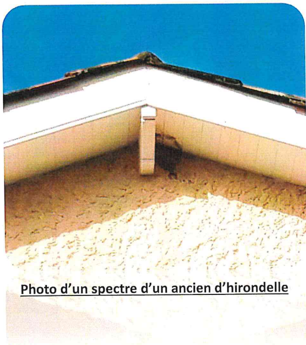
Photo d'un spectre d'un ancien d'hirondelle