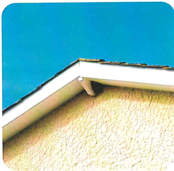
Photo d'un nid existant