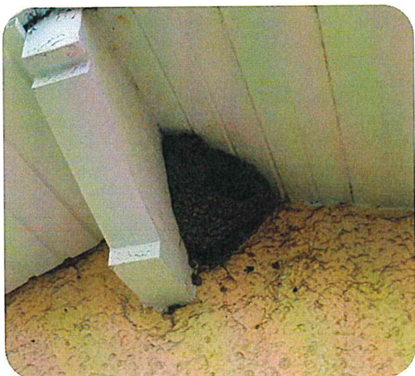
Photo d'un nid nous ayant aidé à déterminer l'espèce d'hirondelle avec l'aide de la LPO