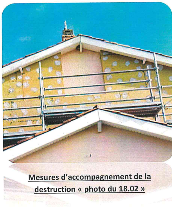
Mesures d'accompagnement de la destruction « photo du 18.02 »