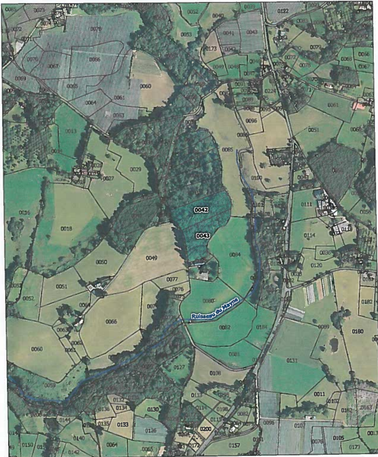
Localisation des parcelles cadastrales concernées par le projet de défrichement de M. Yves FAURE sur la commune de SAINT-SORNIN-LAVOLPS (19230)