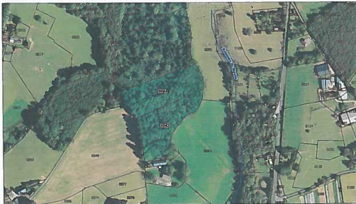
Localisation des parcelles cadastrales concernées par le projet de défrichement de M. Yves FAURE sur la commune de SAINT-SORNIN-LAVOLPS (19230)