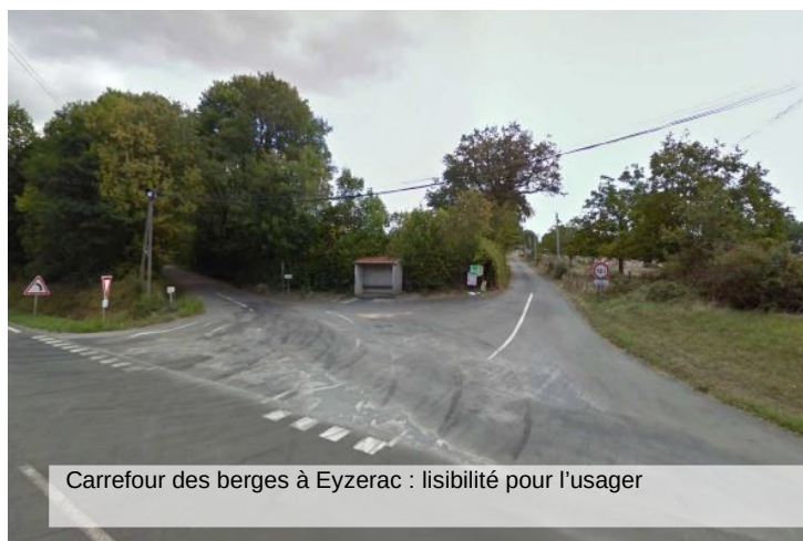
Carrefour des berges à Eyzeraç : lisibilité pour l'utilisateur