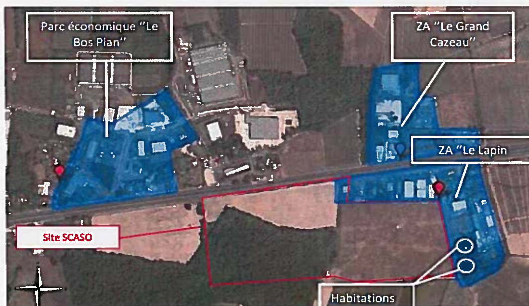
Plan de situation du projet de l'étude d'impact