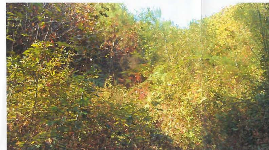
Photo 4 : Partie haute du site difficilement accessible : ronces, buis commun, acacias...