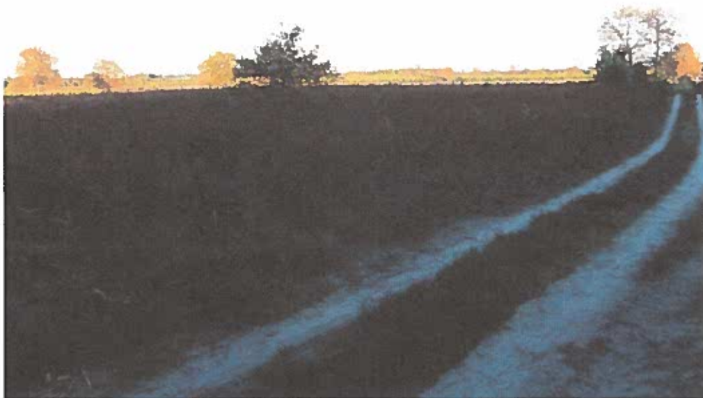
Prise de vue 2