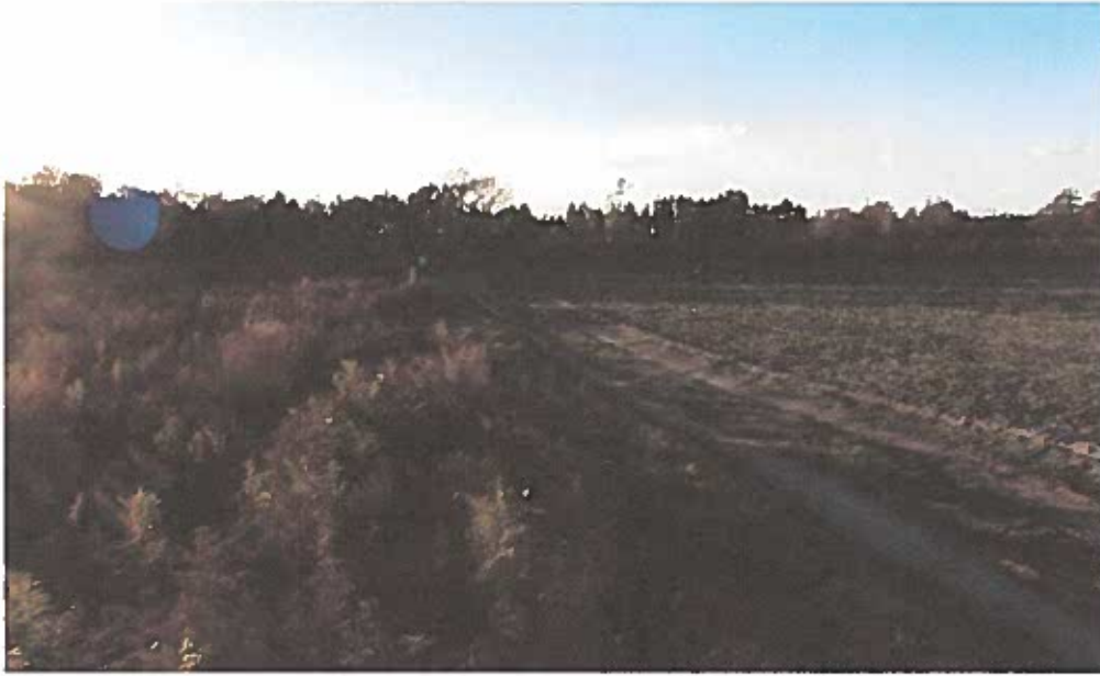
Prise de vue 1