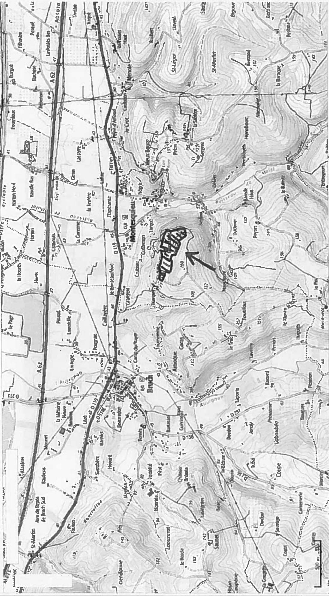
RGF93 : 497626, 6349539 WGS84 : 44°12'56.3"N, 00°28'00.5"E (44.2156, 0.4668) Surface : 0 ha