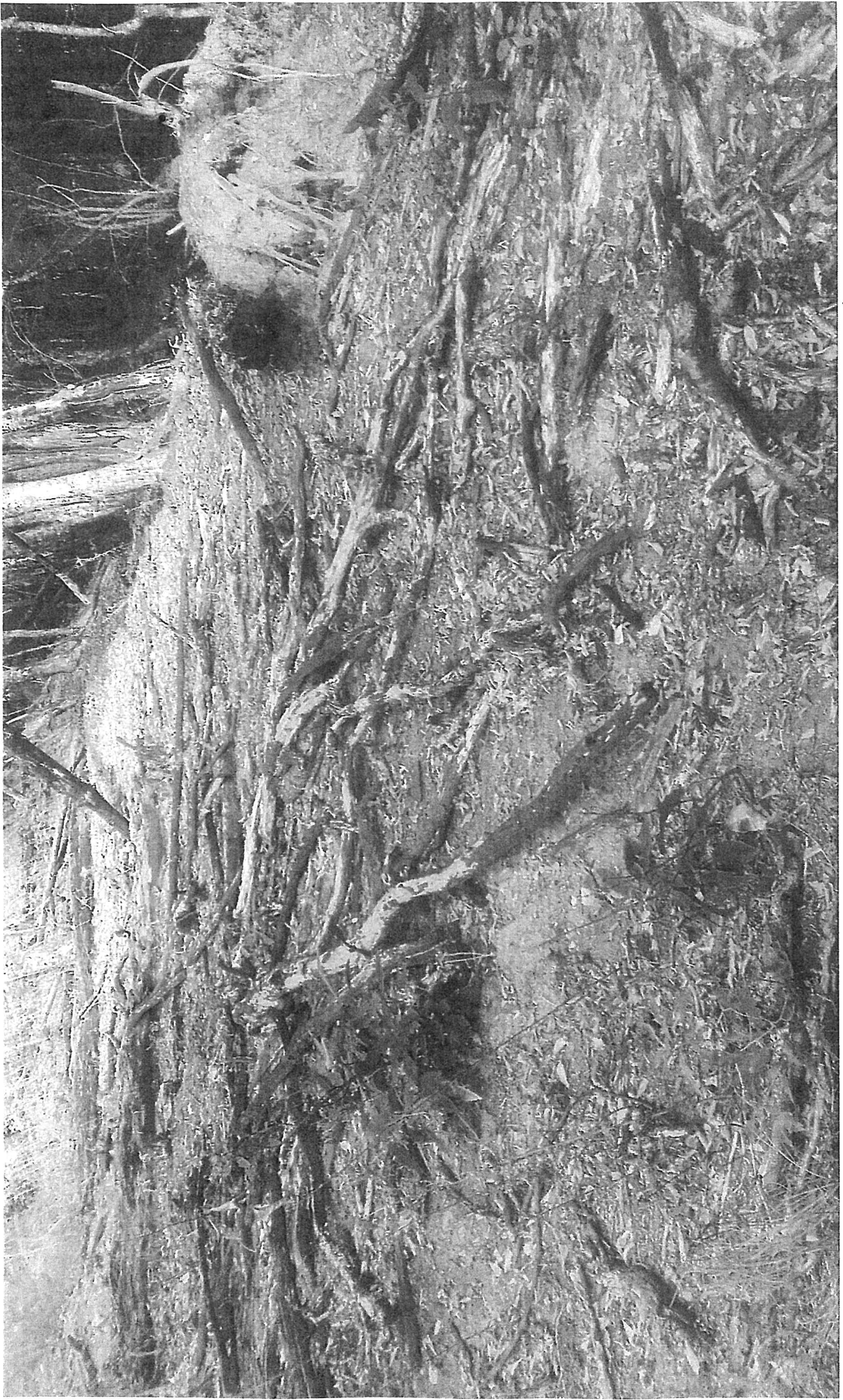
Bas de la ZN 49, à ou 5 mois après l'incendie