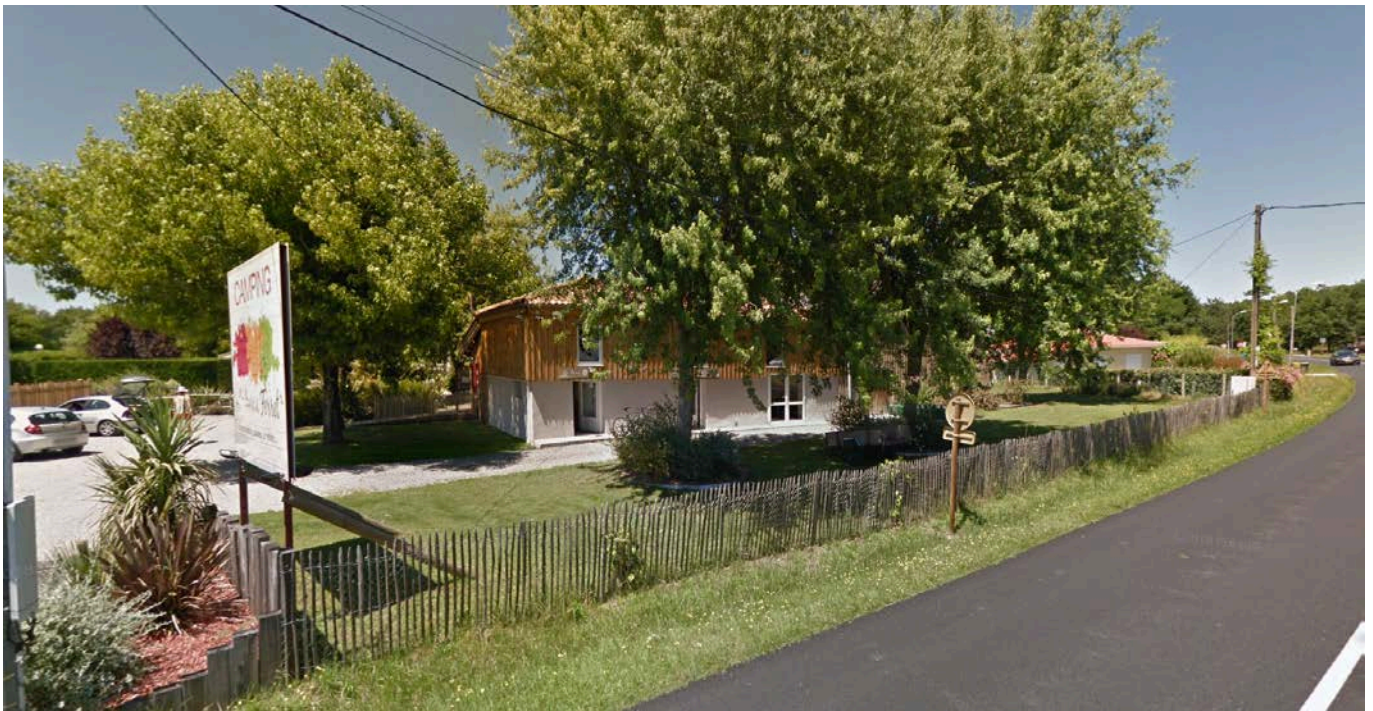
Vue du bâtiment Accueil depuis l'Avenue du Médoc.