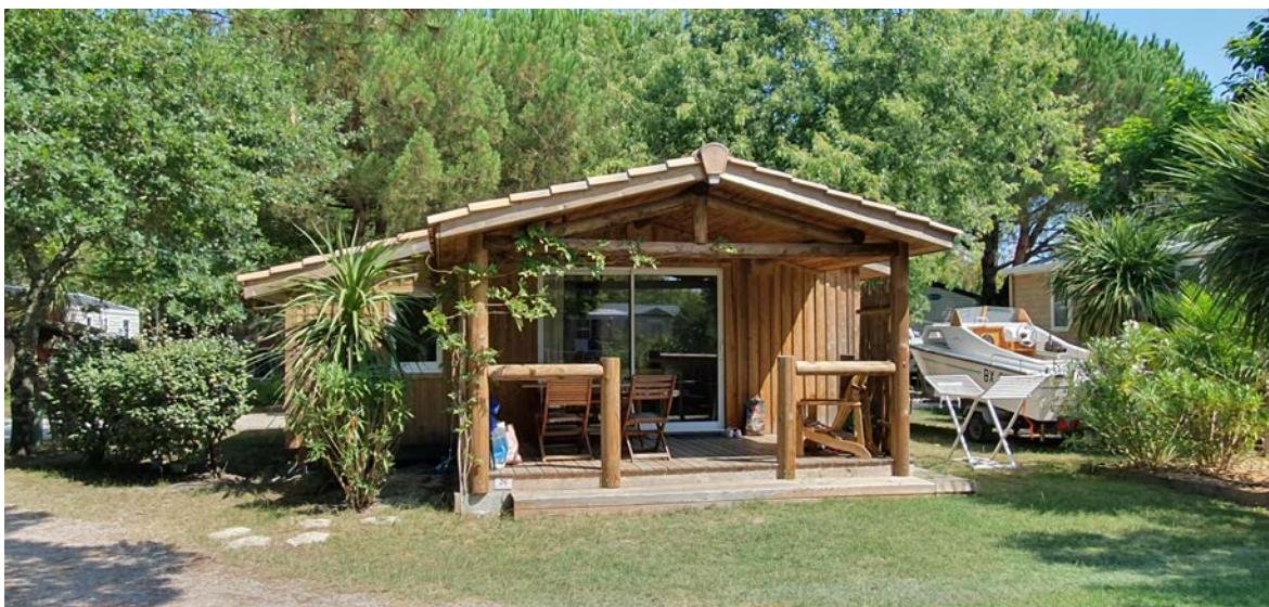
HLL : chalet bois