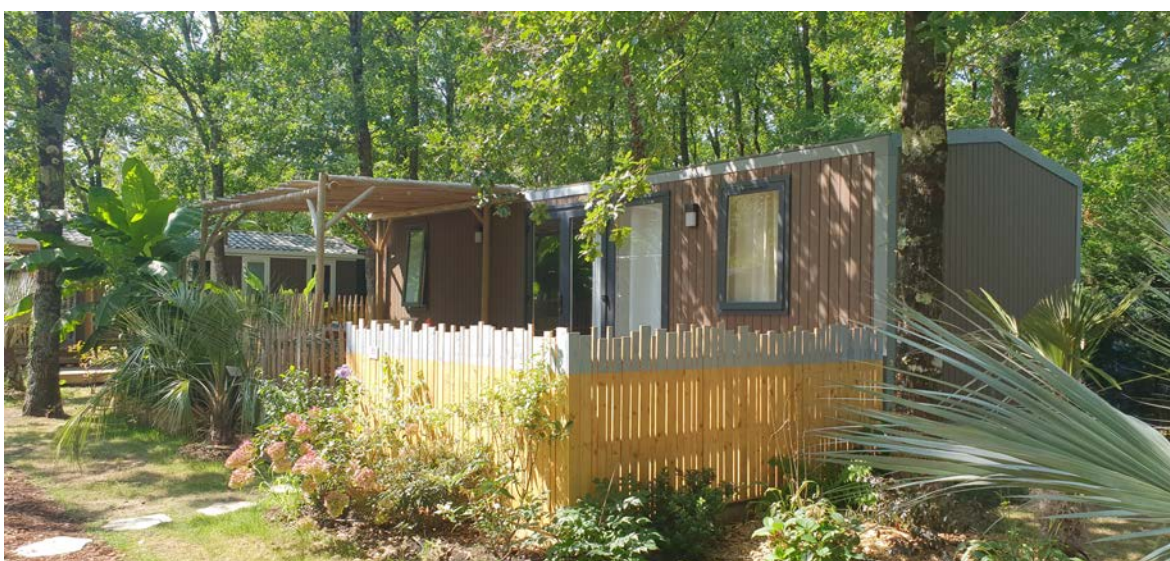
Mobil-home nouvelle génération