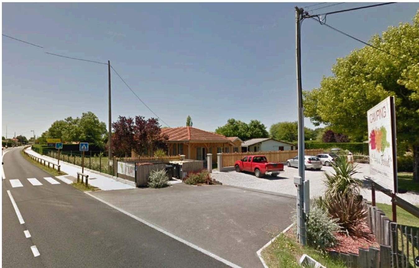
Vue de l'accès au camping depuis l'Avenue du Médoc.