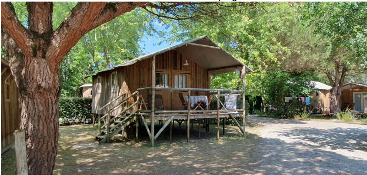
HLL : Cabane sur pilotis

Illustration des installations existantes sur le camping :