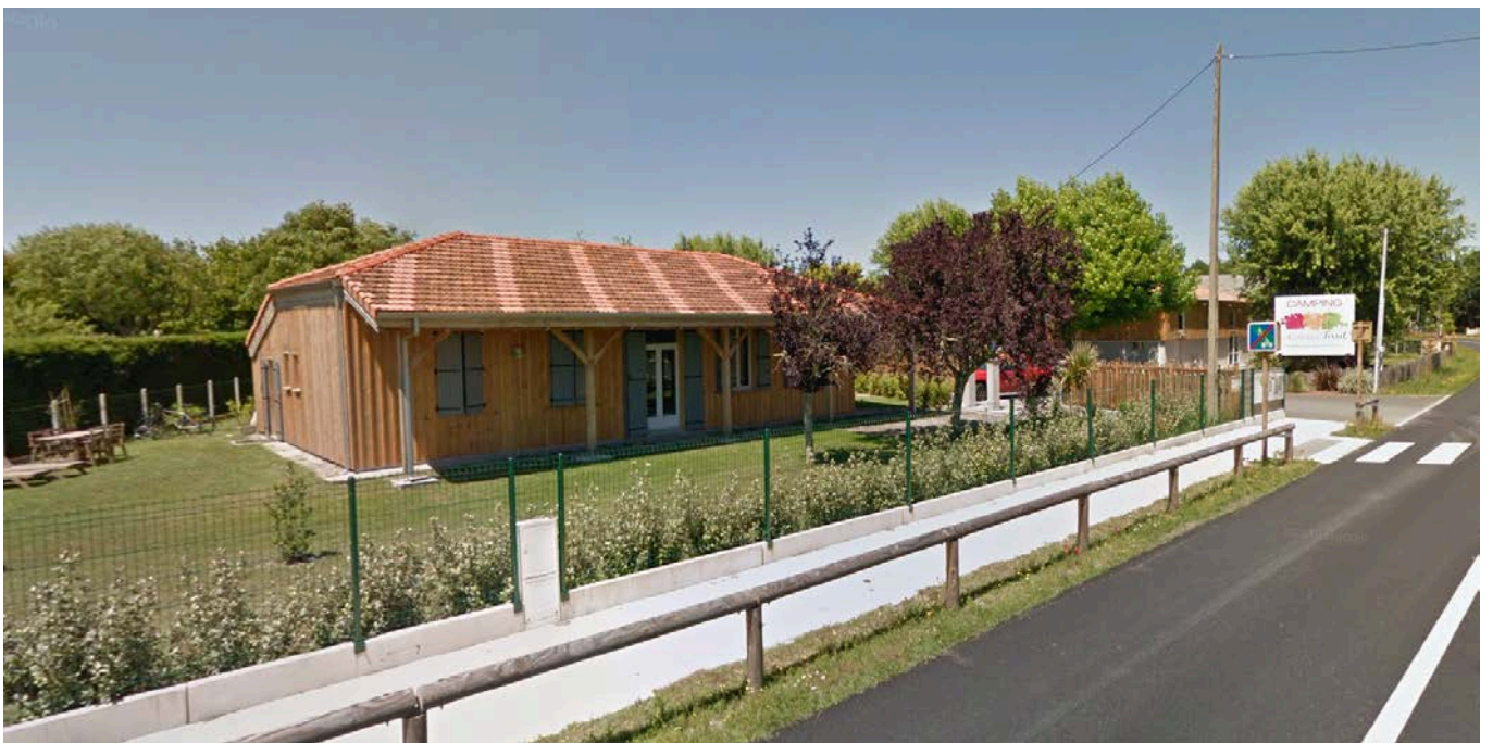
Vue du logement gérant depuis l'Avenue du Médoc.