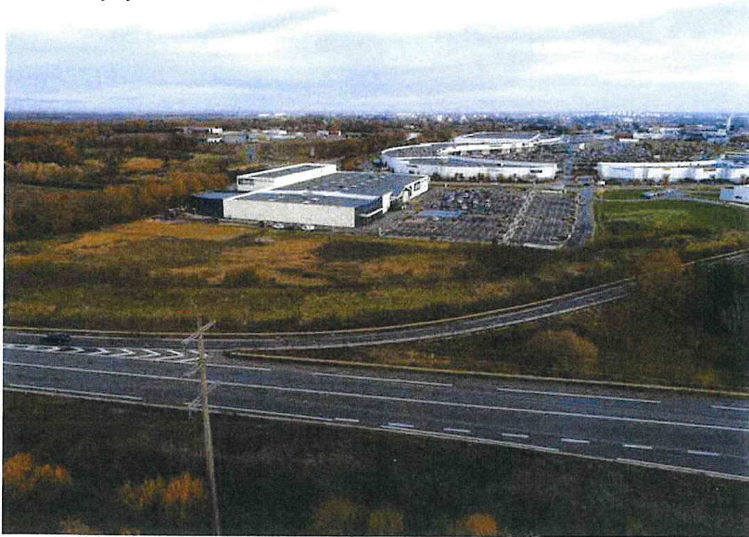
Abords du projet – vue aérienne