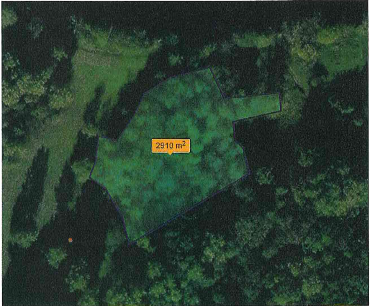
Localisation de la zone à défricher, (carte géoportail scan 25)

La création de la frayère à brochet au sein même de la zone de mesures compensatoires sera d'une surface équivalente à 5000 m 2 . Afin de réaliser les travaux une partie des arbres est à supprimer. La zone concernée correspond à une surface de 2900 m 2 (cf. plan ci-dessous).