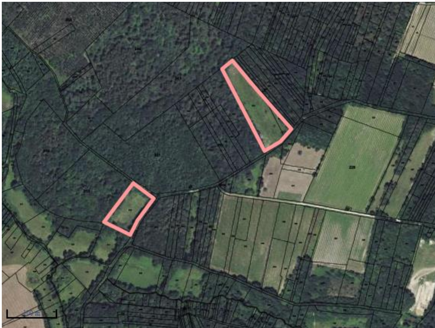
Photo satellite 2018