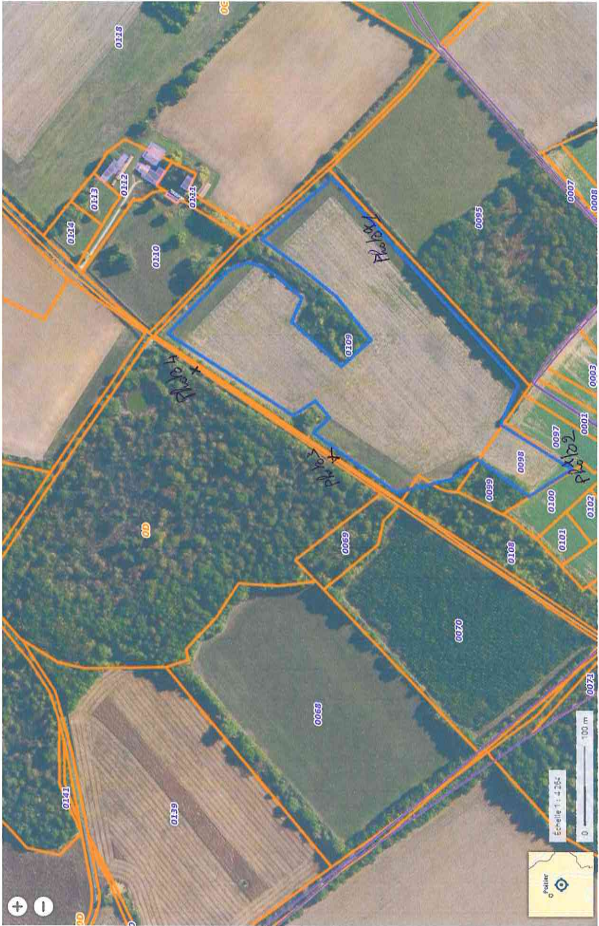
Annexe 3. Localisation des prises de vue.