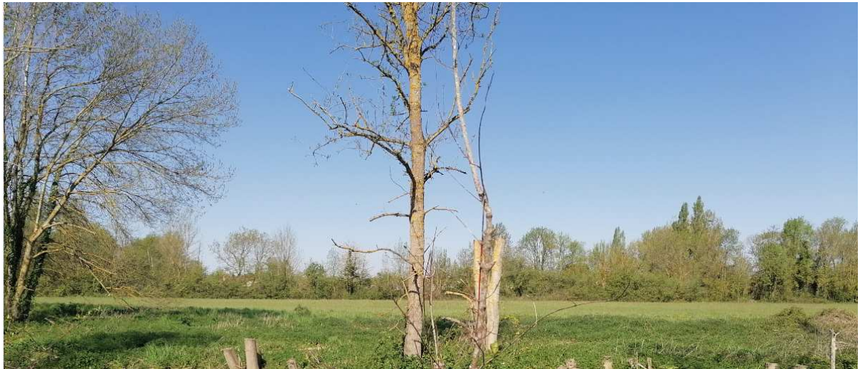
10 Avril photo 2