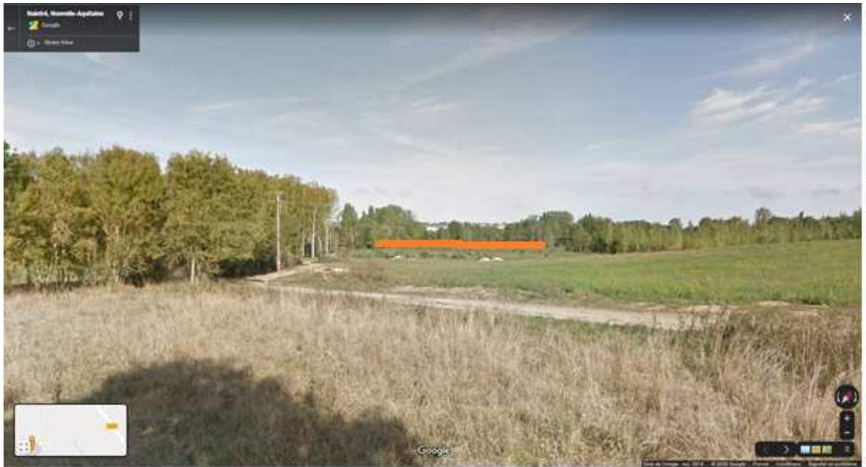
Projet de boisement