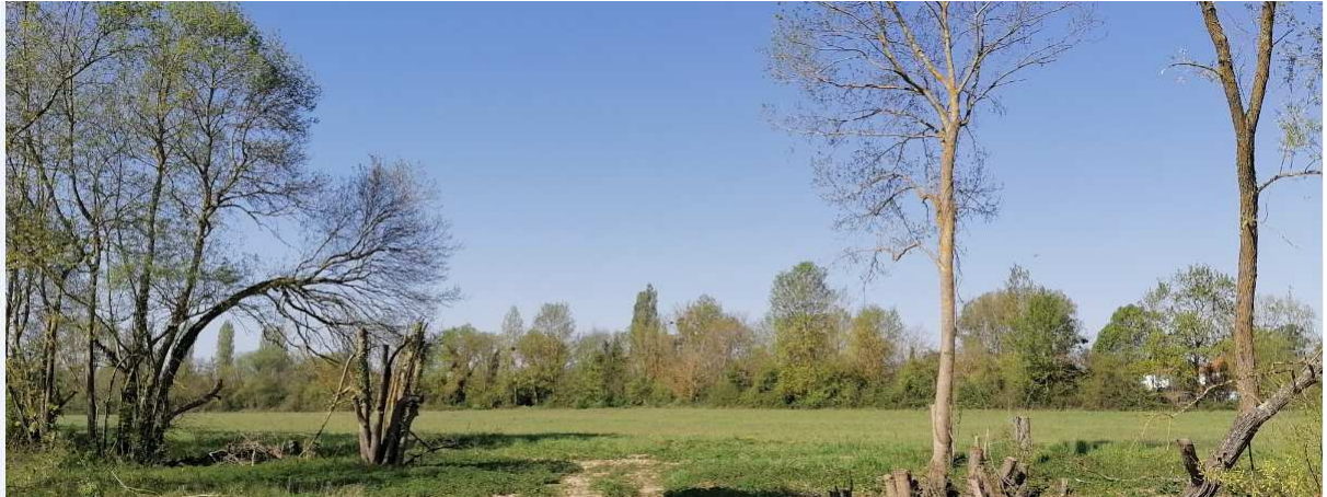
10 Avril photo n°1