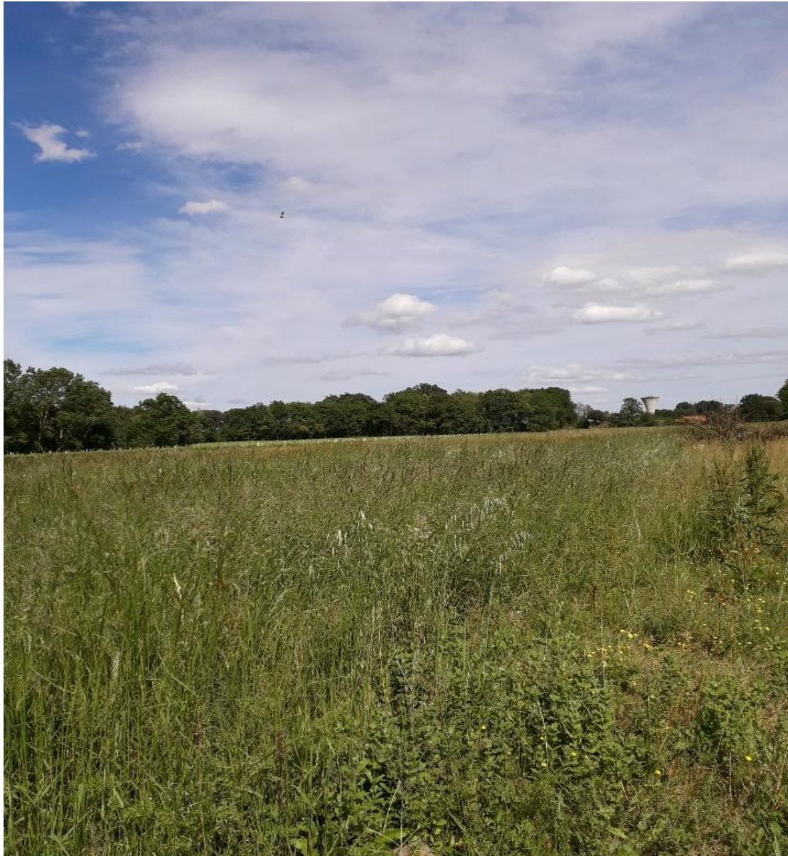
Photo 2(voir emplacement et direction sur annexe 4) : photo rapprochée des parcelles à planter en peupliers situées lieu-dit Mayté Sainte Maure de Peyriac 47170