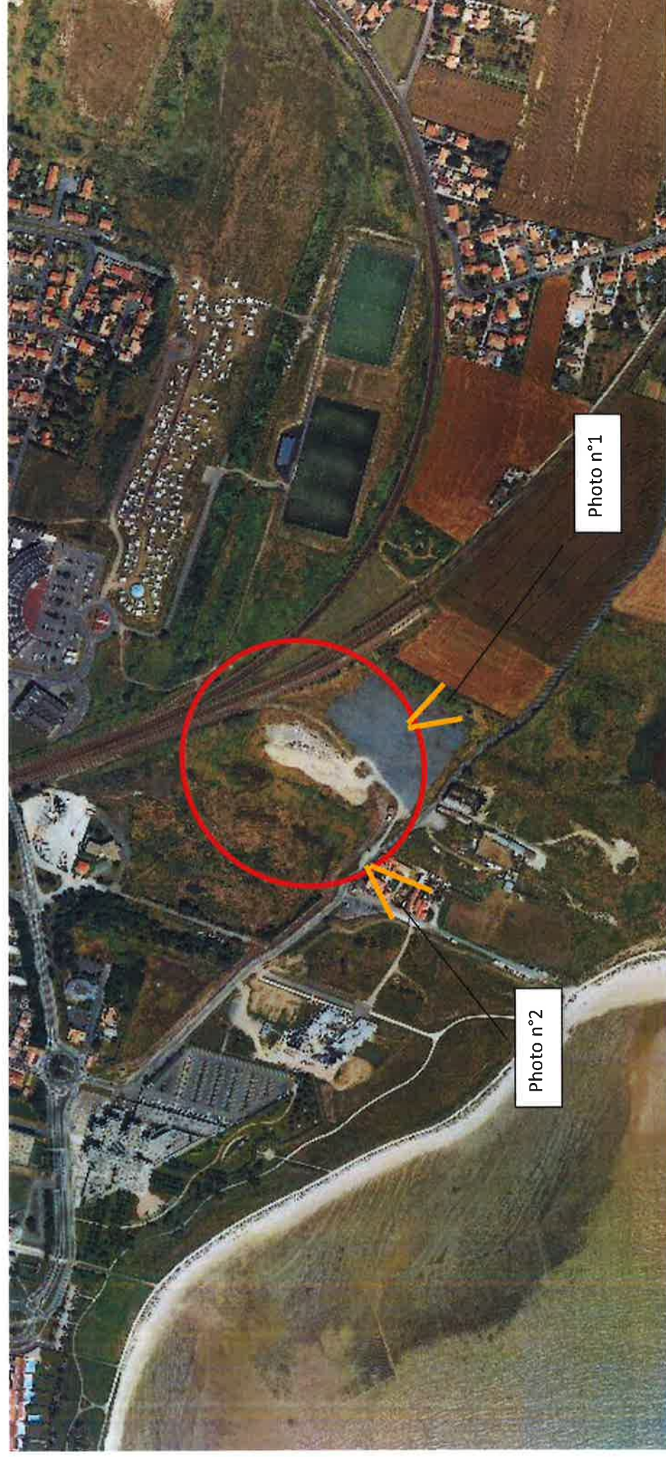
ANNEXE 3 : Photographie aérienne de la zone d'implantation et photographies du site